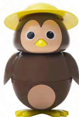
CIP CIOK € 4,80