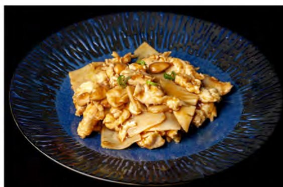
171. Pollo alle mandorle € 8,00 pollo saltato con mandorle e bambu