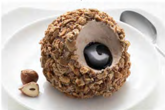
TARTUFO NOCCIOLA € 5,20