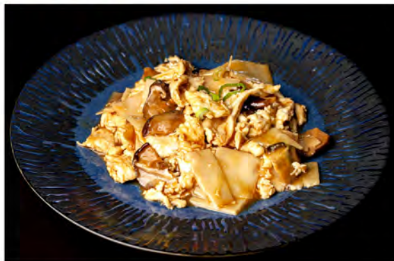
174. Pollo con bambu e funghi € 8,00 pollo saltato con bambu e funghi