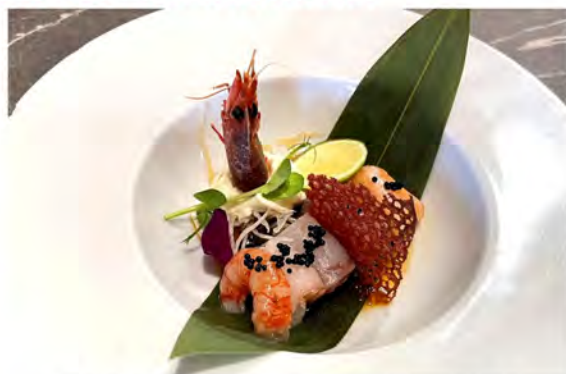
W10. Carpaccio mix speciale € 13,00 fette di pesce misto crudo, salmone, tonno, branzino, ricciola, gambero rosso, guarnito con uova di lompo, salsa ponzu