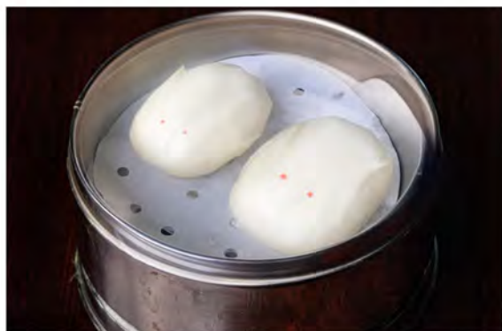
13. Pane dolce cinese € 5,00 pane di latte al vapore con il ripieno di uova