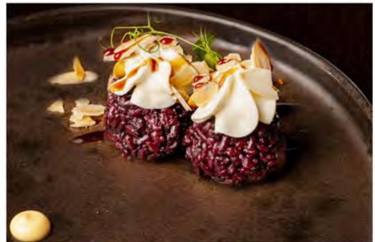
66. Gunkan black mando € 7,50 bocconcino di riso venere guarniti con philadelphia, salsa teriyaki mandorle