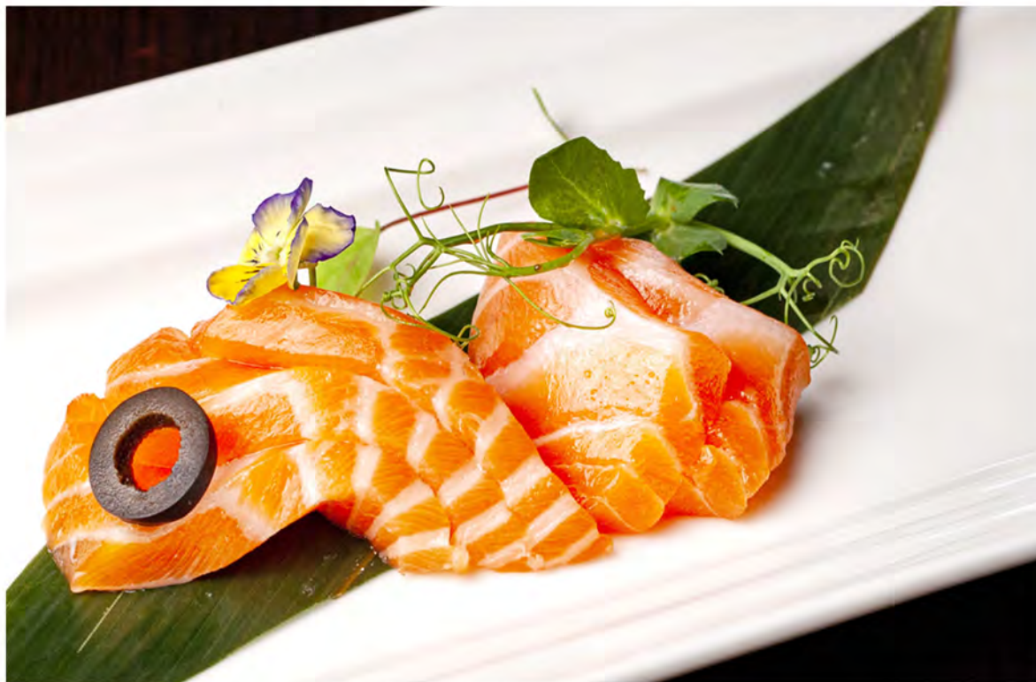
81. Sashimi salmone € 11,00 fette di salmone crudo