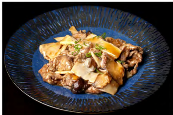
175. Manzo con bambu e funghi € 9,00 manzo saltato con bambu e funghi