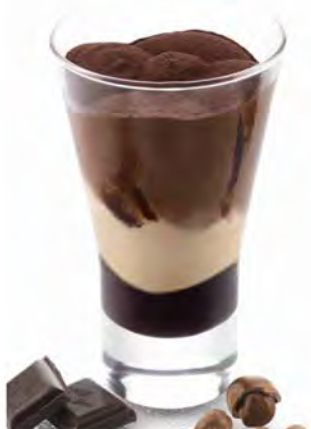
CIOCOLATO E NOCCIOLA € 5,50