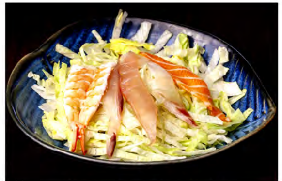
22. Insalata di pesce € 7,00 insalata mista con pesce crudo misto in salsa della casa e sesamo