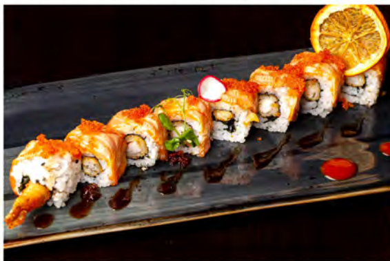
131. Salmon flambe roll € 13,00 rotolo di riso con alghe nori, interno di gamberi fritti salmone scottato con tobiko in salsa teriyaki