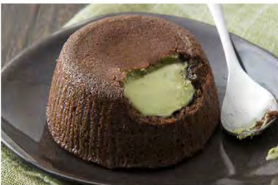
SOUFFLÉ AL PISTACCHIO € 5,00