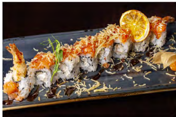
130. Phoenix roll € 12,00 rotolo di riso con alga nori interno farcito con gambero fritto philadelphia guarnito con tartare di salmone, croccante di patate in salsa teriyaki