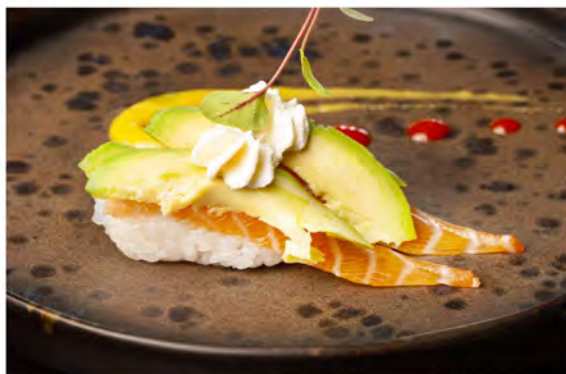
47. Nigiri soft salmone € 5,50 salmone,avocado,philadelphia