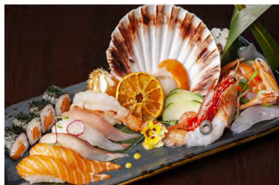
87. Sushi watami € 42,00 piatto misto con nigiri 6pz, uramaki 4pz, hosomaki 4pz sashimi 4pz, gunkan 2pz, scampo crudo 1pz, gambero rosso 1pz capesante 1pz