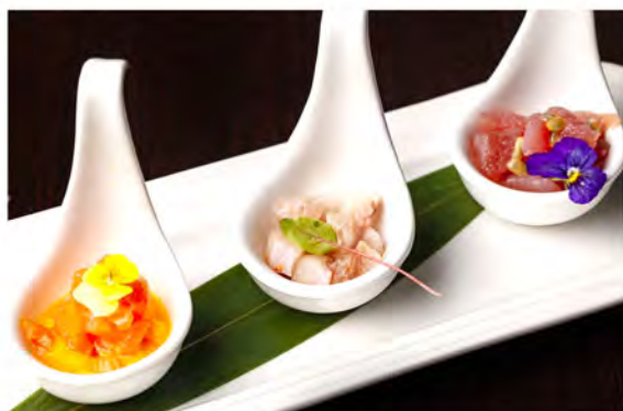
W7. Tris tartare € 11,00 tartare di salmone con salsa di carote, tartare ricciola con salsa ponzu, tartare di tonno con salsa passion fruit