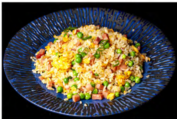
146. Riso cantonese € 6,00 riso saltato con prosciutto,piselli,uova