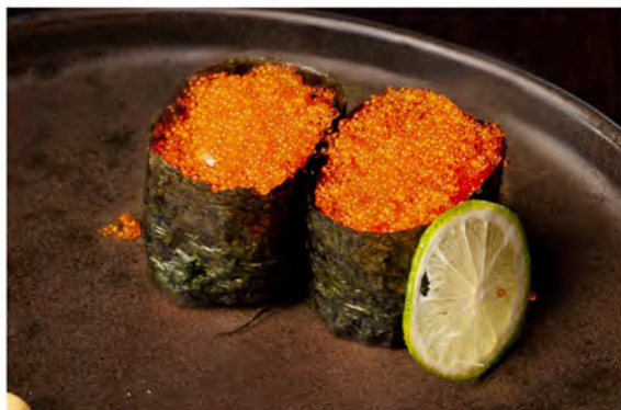
53. Gunkan tobiko € 8,50 bocconcini di riso avvolti da alga nori con uova di pesce