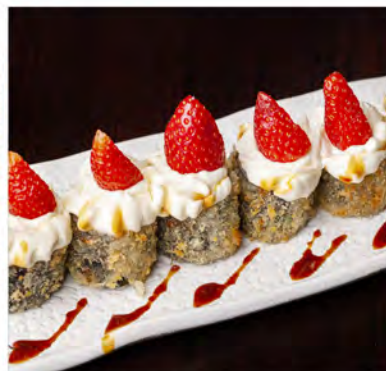
103. Hoso fragola € 8,00 rotolo di riso con alga nori salmone,esterno fragola e philadelphia in salsa teriyaki