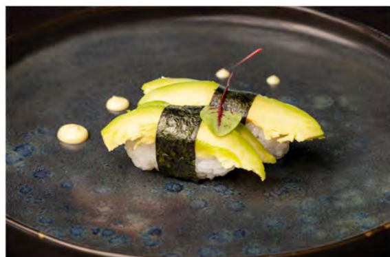
46. Nigiri avocado € 3,50 avocado