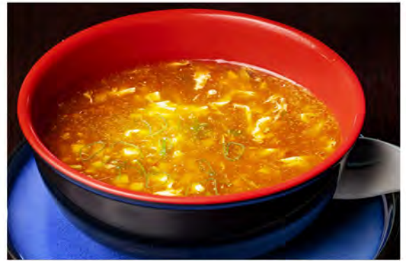
18. Zuppa pechinese € 4,50 tofu,alghie,uova e pollo con salsa piccante