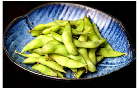
04. Edamame € 4,50 baccelli di soia e sale