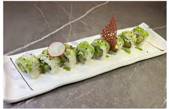
114. Uramaki vegetariano € 7,50 avocado, insalata, maionese e sesamo crema rucola