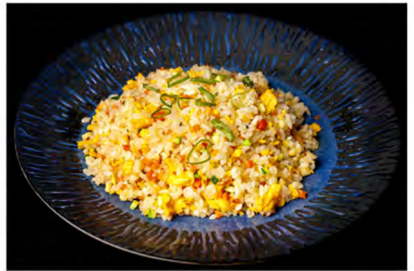
143. Riso verdure € 6,00 riso saltato con verdure miste di stagione,uova