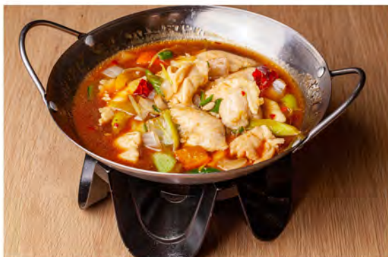
192. Piccola padella con pollo € 8,00 pollo, verdure miste (leggermente piccanti)