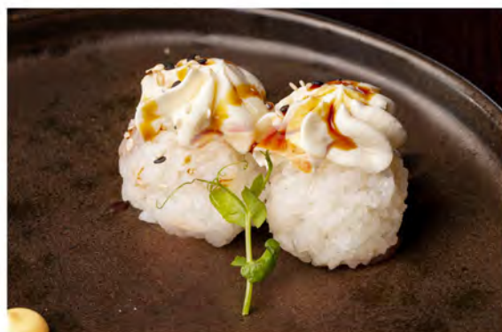
50. Gunkan white € 6,50 riso, philadelphia,sesamo in salsa teriyaki