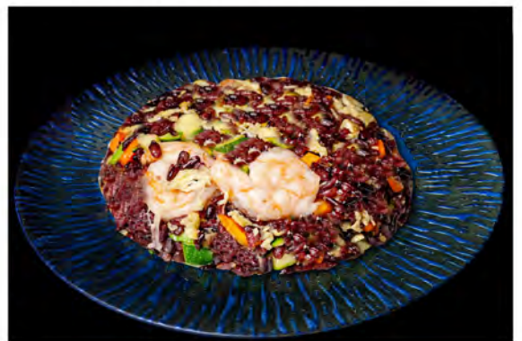
147. Riso venere € 7,50 riso saltato con gamberi, verdure miste di stagione,uova