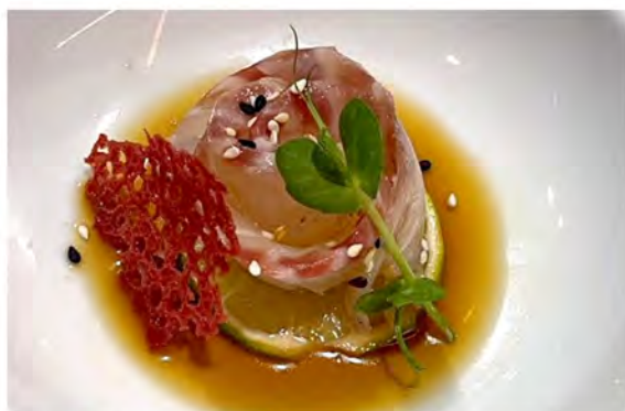
⑤ 35. Carpaccio branzino € 10,00 branzino tagliato a fette sottili con salsa ponzu e sesamo