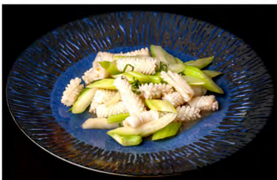
176. Seppia con sedano € 9,00 seppia con sedano