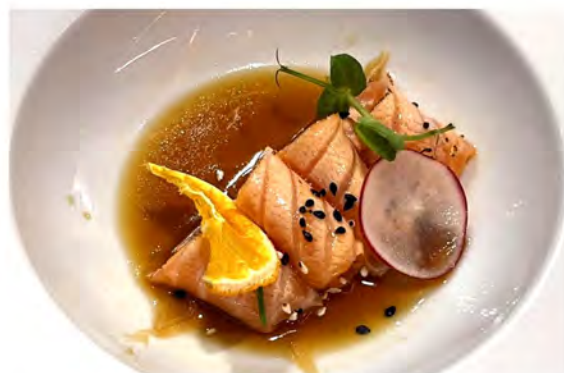
⑤ 36. Carpaccio sake € 10,00 salmone scottato con salsa ponzu e sesamo