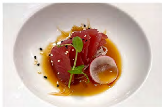
⑤ 34. Carpaccio tonno € 10,00 tonno tagliato a fette sottili con salsa ponzu e sesamo