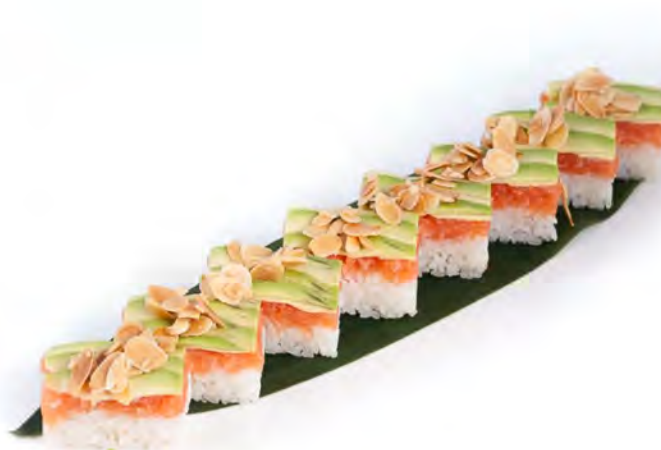
134. Saudade € 10,00 box di riso con sopra spicy salmone, avocado, mandorle, salsa teriyaki