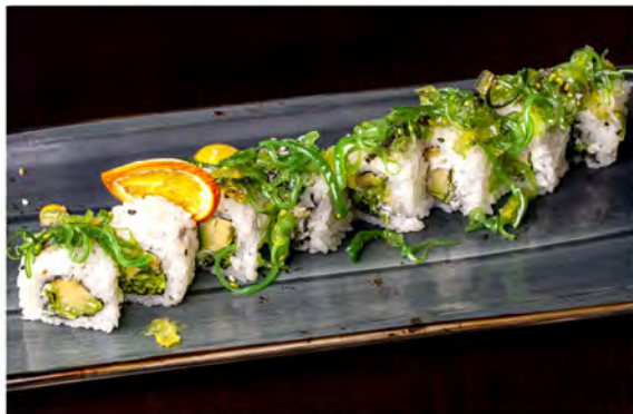
115. Wakame roll € 9,00 avocado, philadelphia, insalata, alga nori, riso e alghie piccanti all'esterno e sesamo crema di rucola