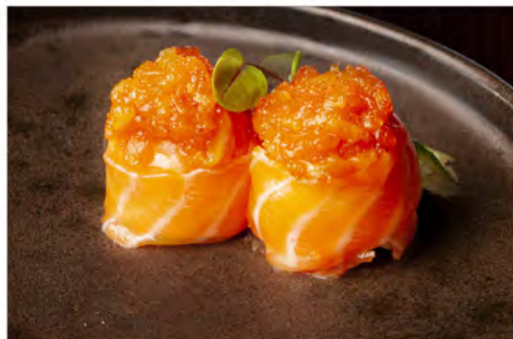
54. Gunkan spicy sake € 7,00 bocconcini di riso e coperto da tartare di salmone, maionese,tobiko,salsa piccante