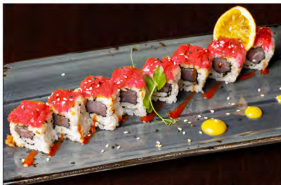
111. Uramaki spicy tuna € 11,00 tartare di tonno,maionese,tobiko,salsa piccante, alga nori,sesamo riso