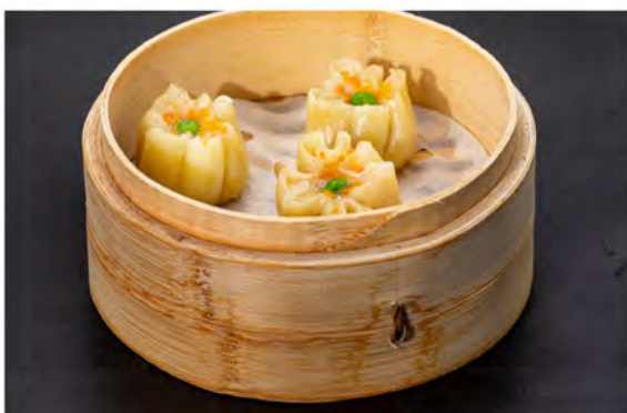
07. Ravioli di gamberi € 7,00 gamberi, carne di maiale in salsa di soia