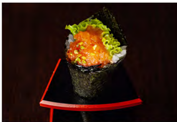
76. Temaki spicy sake € 5,00 salmone piccante,insalata