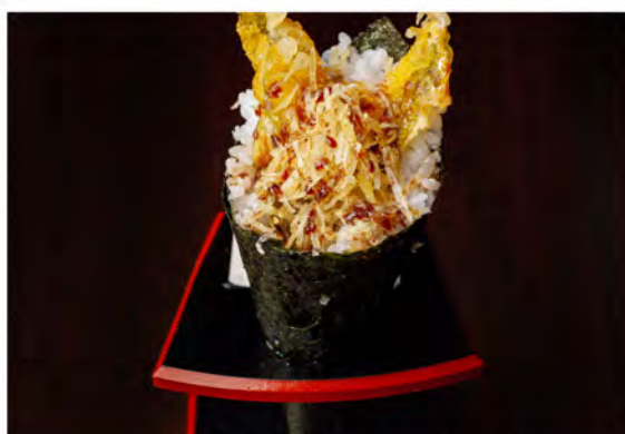
80. Temaki flower € 6,50 gambero fritto,tempura di fiori di zucca philadelphia kataifi con salsa teriyaki