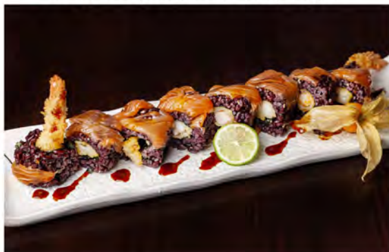
139. Black tiger roll € 12,50 rotolo di riso venere con alga nori interno, farcito,gambero fritto maionese,guarnito con salmone,salsa teriyaki