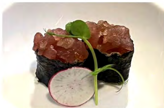
52. Gunkan tuna € 8,00 bocconcini di riso avvolto con alga nori coperto da tartare di tonno piccante