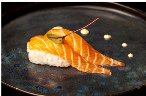
39. Nigiri salmone € 4,00 salmone crudo