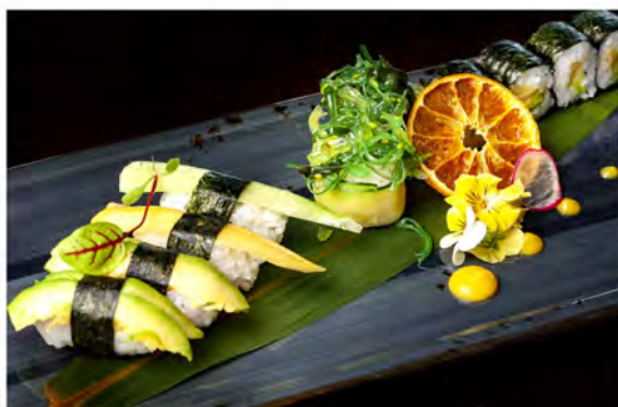
86. Sushi vegetariano € 10,50 4pz nigiri, 4pz hosomaki, 2pz gunkan