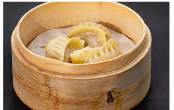
06. Ravioli di carne € 6,00 carne di maiale in salsa di soia