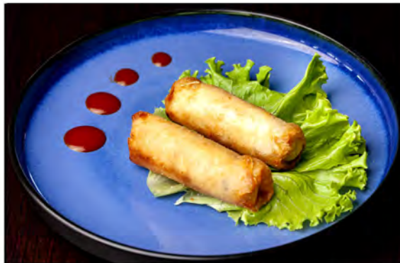
03. involtini vietnamiti € 7,00 involtino con carne e gamberi