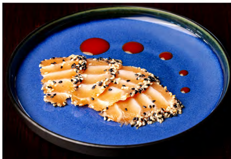
④ 164. Salmone tataki € 12,00 salmone in crosta di sesamo scottato con salsa teriyaki