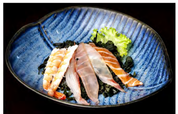
24. Sunomono € 7,00 alghie giapponese in salsa ponzu e pesce misto e sesamo