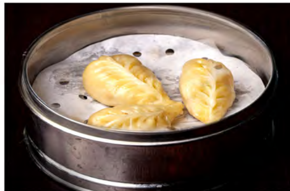
10. Ravioli di verdure € 5,50 verdure in salsa di soia