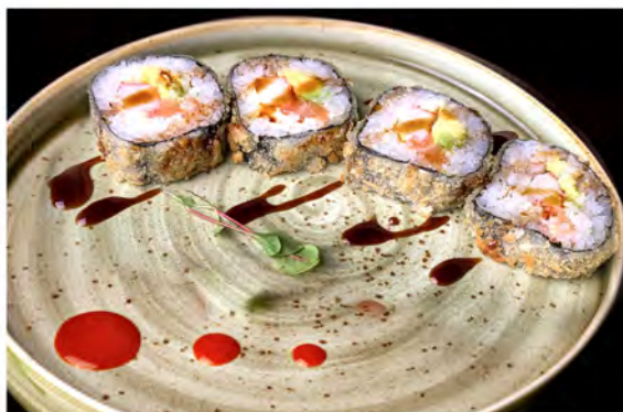
93. Futomaki fritto € 10,50 salmone, avocado, surimi, philadelphia e alga nori fritto in salsa teriyaki