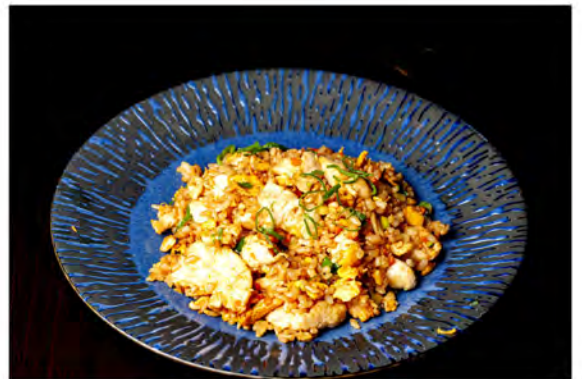
145. Riso pollo € 7,00 riso saltato con pollo, verdure miste di stagione,uova