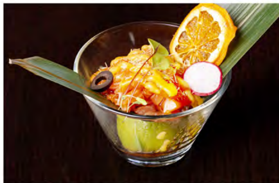
● 29. Tartare sunrise € 11,00 tartare di salmone con salsa ponzu e salsa mango guarnito con kataifi