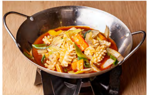
191. Piccola padella con calamari € 9,00 calamari, verdure miste (leggermente piccanti)