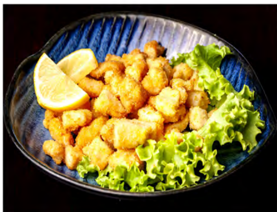
183. Bocconcini di pollo € 7,00 cubetti di pollo fritto