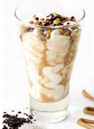
COCCO NOCCIOLA € 5,50