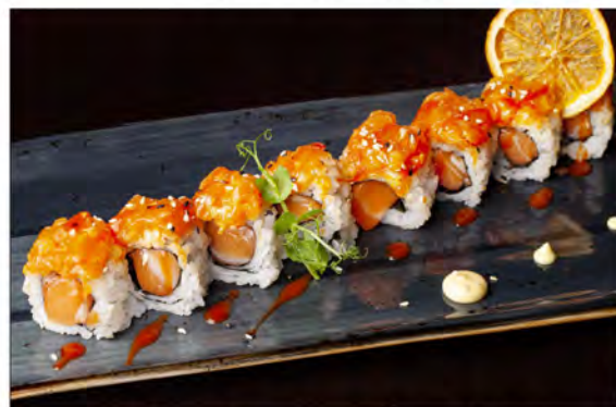
110. Uramaki spicy sake € 10,00 tartare di salmone,maionese,tobiko, salsa piccante,alga nori,sesamo riso