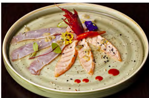
W11. Carpaccio mix scottato € 12,00 fette di pesce misto scottato, salmone, tonno, capesante gambero rosso guarnito sesamo con passion fruit