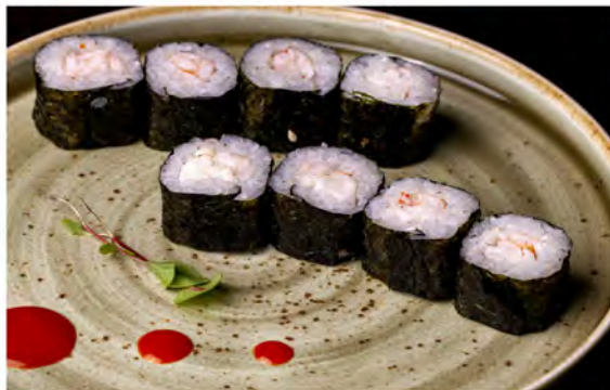
96. Hoso ebi € 5,50 gambero cotto,riso,alga nori