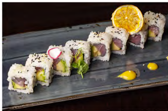
106. Uramaki tonno avocado € 10,00 rotolo di riso con alga nori interno, farcito con tonno,avocado sesamo