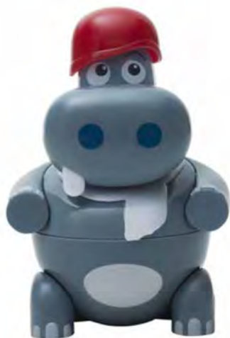
HIP POP € 4,80