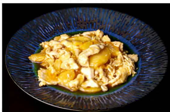
170. Pollo al curry € 8,00 pollo saltato con salsa curry con latte di cocco e patate