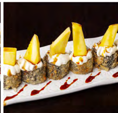
104. Hoso mango € 8,00 rotolo di riso con alga nori salmone,esterno mango e philadelphia in salsa teriyaki