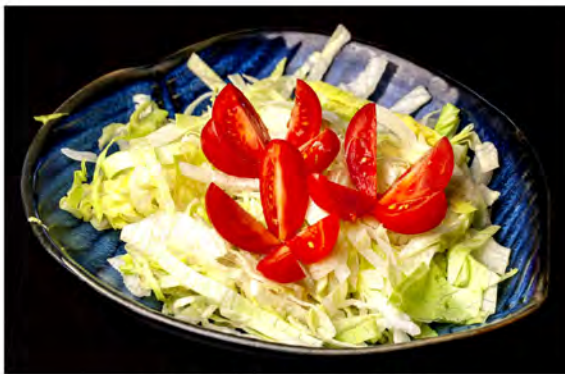
21. Insalata mix € 6,00 lattuga,carote,pomodorini in salsa della casa e sesamo