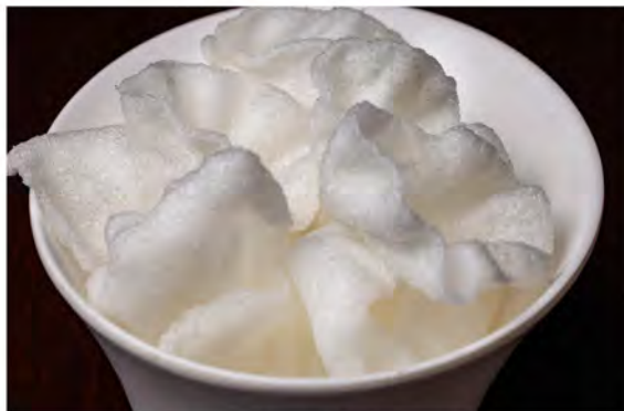
05. Nuvole di drago € 4,00 chips di gamberi