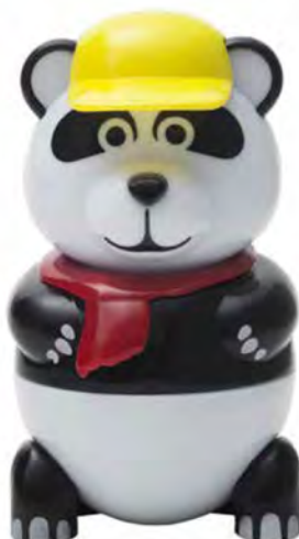
PAN DAN € 4,80