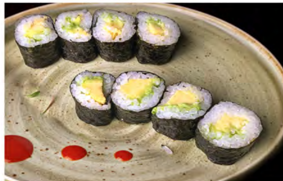
97. Hoso avocado € 5,50 avocado,riso,alga nori