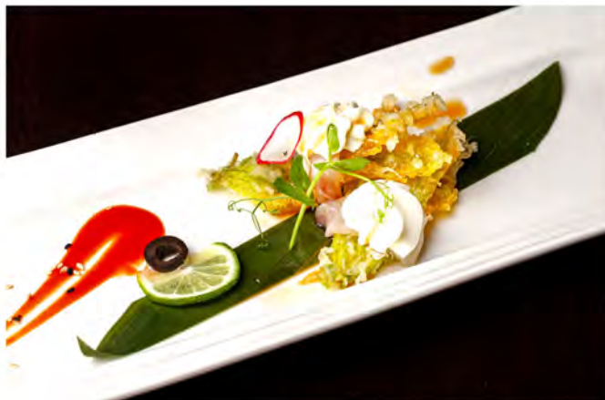
W17. Carpaccio flower white € 9,00 tempura fiori di zucca e philadelphia con salsa ponzu, guarnito da carpaccio di branzino

I PIATTI SPECIALI POSSONO ESSERE SCELTI MASSIMO 2 DIFFERENTI A PERSONA