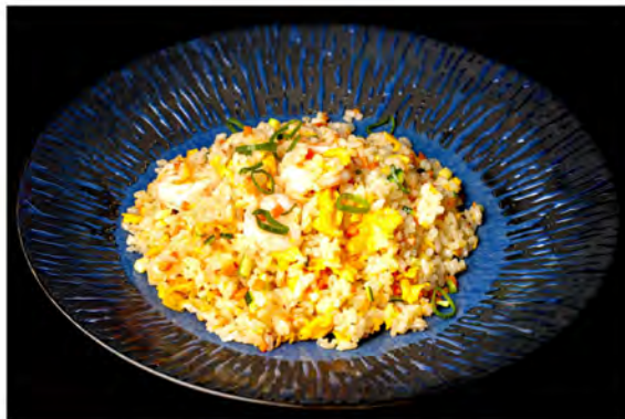
144. Riso gamberi € 7,00 riso saltato con gamberi, verdure miste di stagione,uova