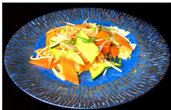
177. Misto di verdure saltato € 6,00 verdure miste di stagioni saltate