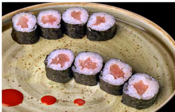
100. Hoso tuna € 6,50 tonno,riso,alga nori