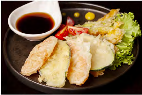
187. Tempura verdure € 9,00 fiore di zucca, zucchini, carote, melanzane fritte in tempura