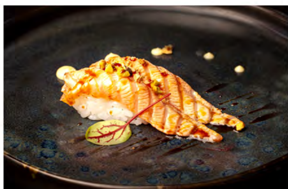
43. Nigiri sake flambe € 5,00 salmone scottato, granella di pistacchio in salsa teriyaki