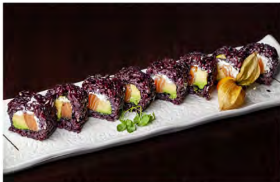
135. Ura venere € 10,50 rotolo di riso venere con alga di nori interno, farcito con salmone,avocado,philadelphia