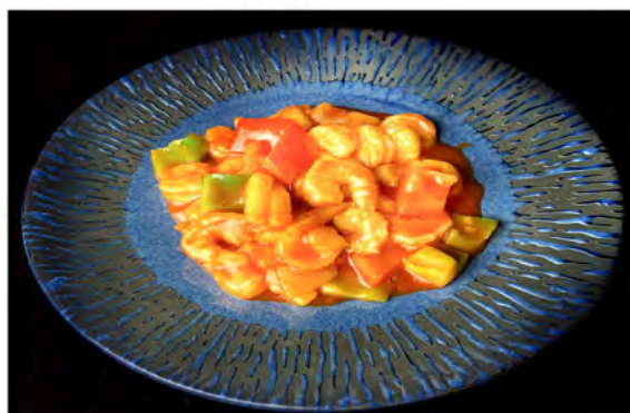
168. Gamberi agrodolce € 9,00 gamberi saltati con peperoni, ananas in agrodolce