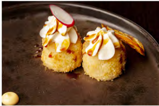
63. Gunkan fry philadelphia € 7,50 bocconcini di riso fritti guarniti con philadelphia in salsa teriyaki