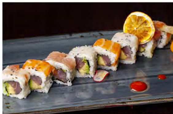
122. Tuna rainbow roll € 13,00 rotolo di riso con alga nori interno,farcito con tonno, avocado,guarnito con pesce misto