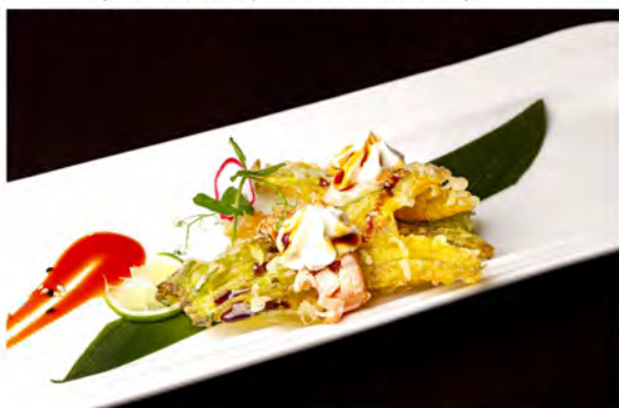
W15. Carpaccio flower sake € 8,00 Tempura di fiori di zucca e philadelphia, avvolto con salmone scottato guarnito salsa teriyaki