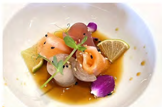
● 38. Carpaccio mix € 10,00 pesce crudo misto tagliato a fette sottili in salsa ponzu sesamo