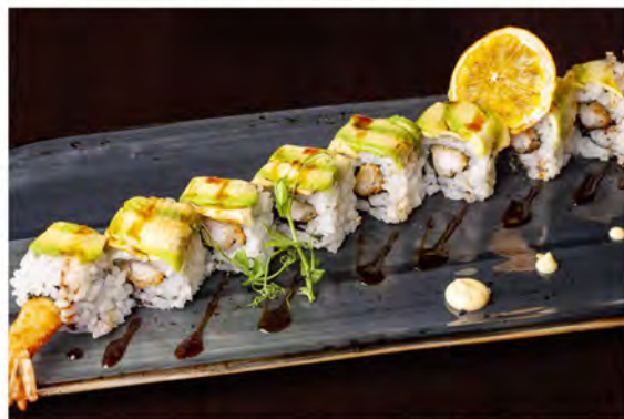
132. Dragon roll € 12,00 rotolo di riso con alghe nori, interno di gamberi fritti con maionese, avocado esterno in salsa teriyaki