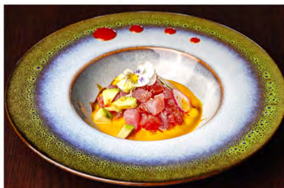
W4. Tartare tuna € 11,00 tartare di tonno con avocado, salsa carote, guarnito con kataifi in salsa teriyaki