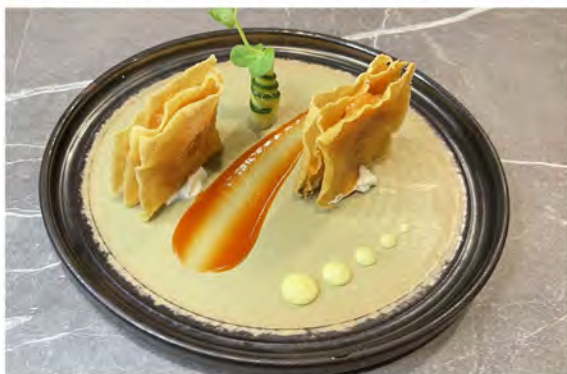
W1. Millefoglie salmone € 9,00 sfoglia croccante con salmone piccante maionese, tobiko e philadelphia

I PIATTI SPECIALI POSSONO ESSERE SCELTI MASSIMO 2 DIFFERENTI A PERSONA