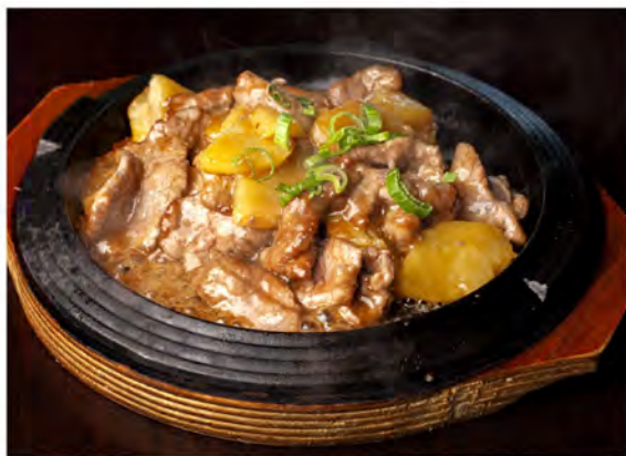
178. Manzo alla piastra patate € 9,00 manzo alla piastra con patate e burro