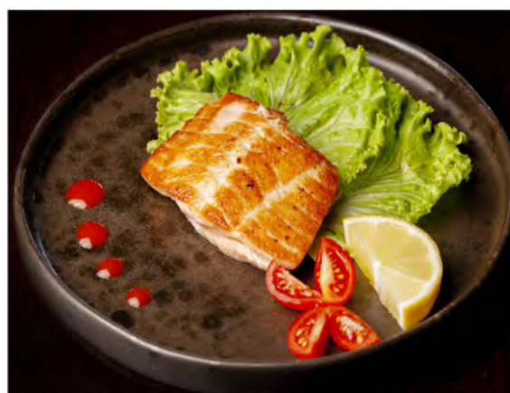
160. Salmone alla piastra € 9,00 salmone con salsa teriyaki e sesamo