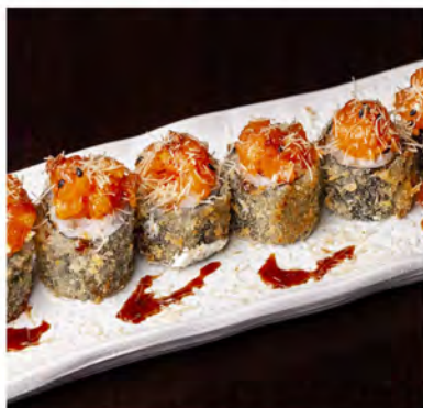
102. Hoso maki fritto € 8,00 hoso salmone fritto e tartare di salmone piccante, pasta kataifi all'esterno e salsa teriyaki