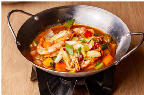
190. piccola padella con gamberi € 9,00 gamberi, verdure miste (leggermente piccanti)