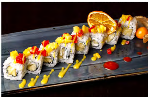
121. Fruit roll € 11,00 rotolo di riso con alga nori interno farcito con ananas philadelphia,guarnito con tartare di mango,fragola,salsa mango