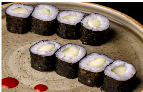
98. Hoso cetrioli € 5,00 rotolo di riso con alga nori cetrioli