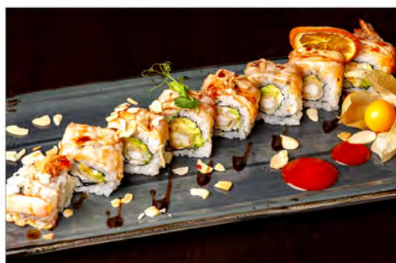
128. Tiger plus € 13,00 rotolo di riso con alga nori interno con gambero fritto,avocado philadelphia e ricoperto con salmone scottato,scaglie di mandorle in salsa teriyaki