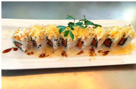
117. Fish and chips roll € 11,00 salmone, crunchy, alga nori, riso e philadelphia all'esterno patate croccanti in salsa teriyaki