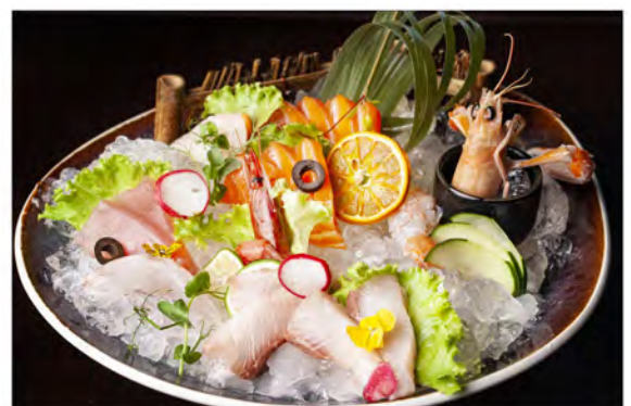
W25. Sashimi speciale € 25,00 4pz salmone, 2pz tonno, 1pz branzino, 2pz ricciola 1pz capesante, 1pz gambero rosso, 1pz scampo