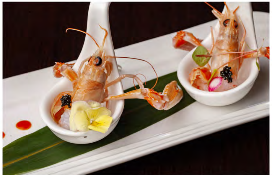
W23. Scampi tropical € 9,00 scampi con salsa passion fruit uova di lompo