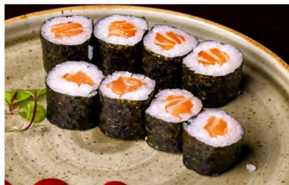
99. Hoso sake € 5,50 salmone,riso,alga nori