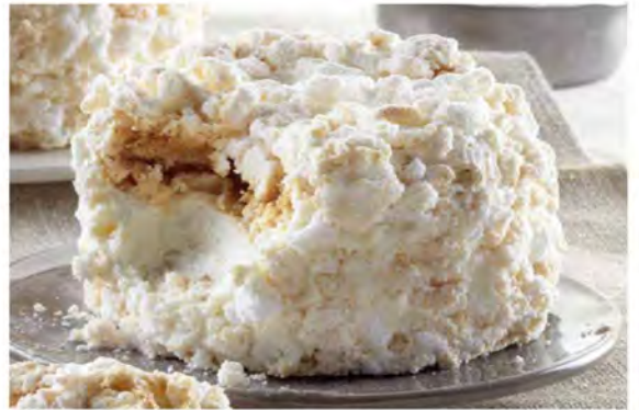
MERINGA € 5,50