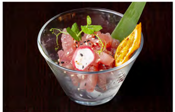
● 28. Tartare tonno € 10,00 tonno, tagliato a mano con salsa ponzu e sesamo