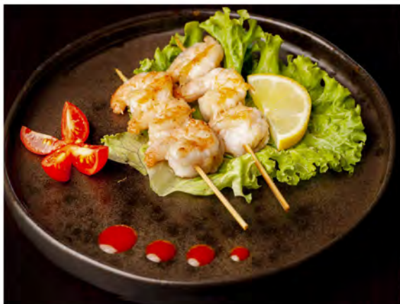
157. Spiedini di gamberi € 7,50 gamberi con salsa teriyaki e sesamo