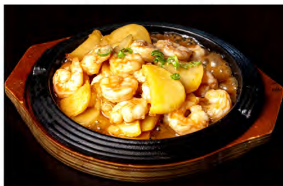
169. Gamberi patate alla piastra € 9,00 gamberi saltati con patate e burro alla piastra