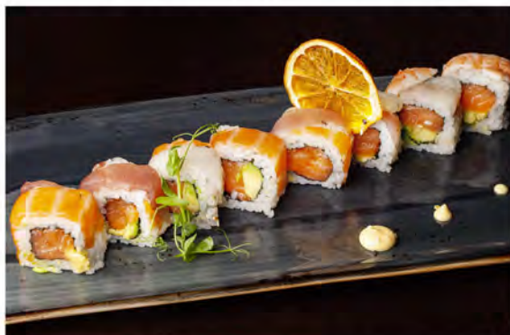
119. Rainbow roll € 12,00 salmone, avocado, alga nori, riso e pesce misto crudo all'esterno