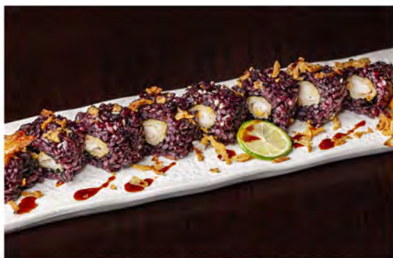
137. Black ebi roll € 10,50 rotolo di riso venere con alga nori esterno, farcito con gambero fritto,maionese guarnito con crunch cipolla, sesamo salsa teriyaki