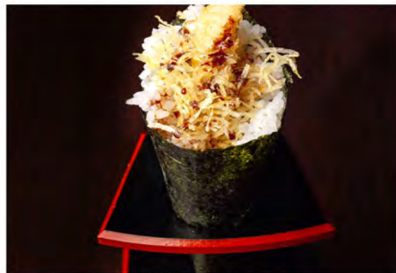
79. Temaki ebiten € 6,00 gambero fritto,salsa teriyaki,maionese, croccante di patate