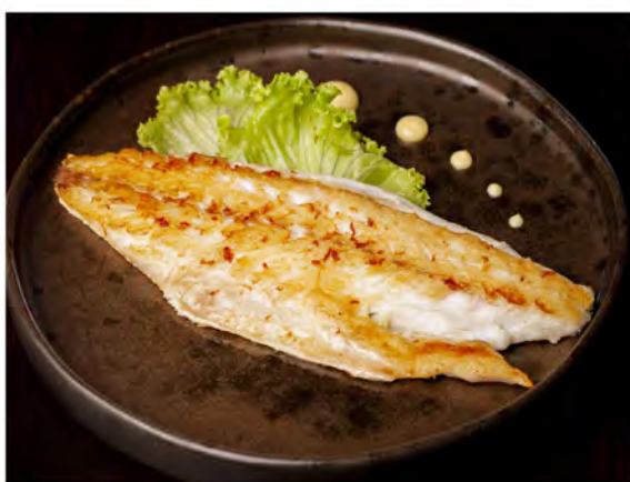
161. Branzino alla piastra € 9,00 branzino con salsa teriyaki e sesamo