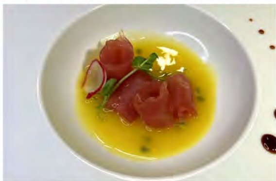
W9. Carpaccio passion tuna € 11,00 fette di tonno guarnito con passion fruit

I PIATTI SPECIALI POSSONO ESSERE SCELTI MASSIMO 2 DIFFERENTI A PERSONA