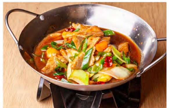
193. Piccola padella con manzo € 9,00 manzo, verdure miste (leggermente piccanti)