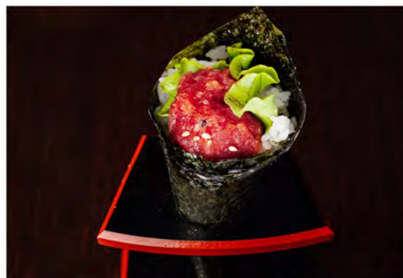
77. Temaki spicy tuna € 6,00 tonno piccante,insalata