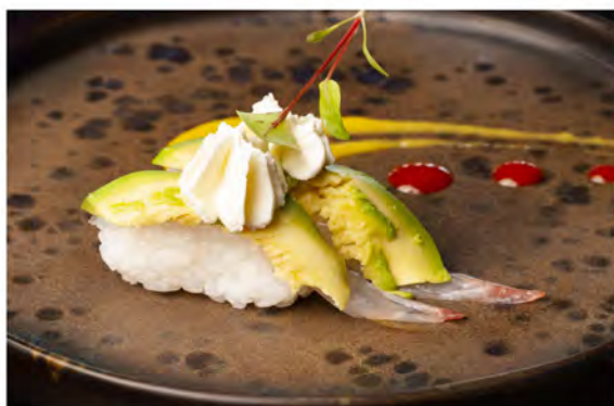
49. Nigiri soft branzino € 6,00 branzino,avocado,philadelphia