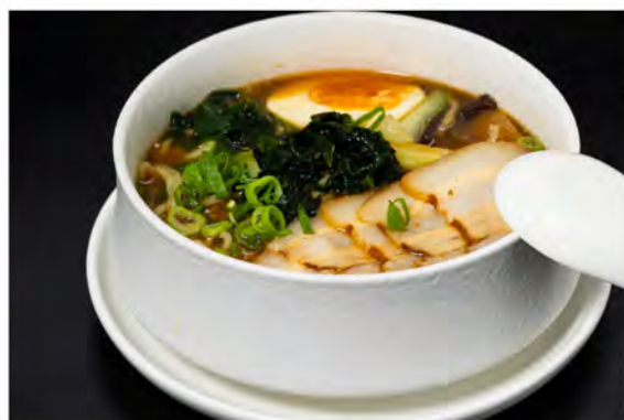
155. Ramen con maiale € 7,00 maiale,verdure di stagioni e cipollina,uova