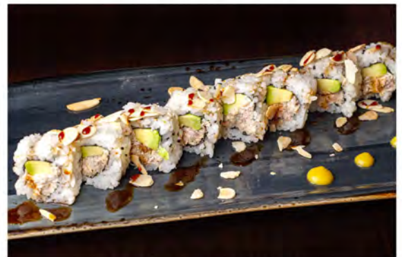
118. Mando roll € 10,00 salmone grigliato, philadelphia, alga nori, riso e mandorle tostate all'esterno salsa teriyaki