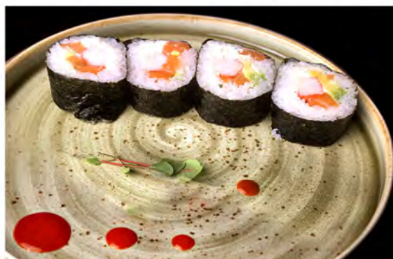
95. Futomaki salmon € 10,00 rotolo di riso con alga nori esterno con salmone avocado, philadelphia, surimi