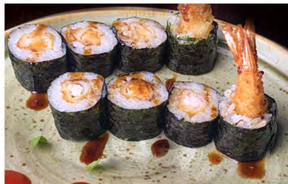
101. Hoso ebiten € 6,50 rotolo di riso con alga nori con gambero fritto maionese in salsa teriyaki