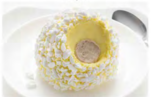
TARTUFO BIANCO € 5,20