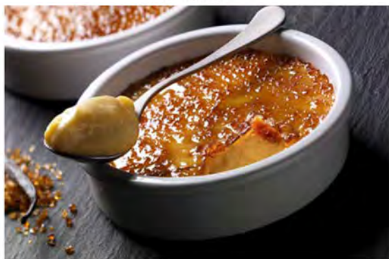
CREMA CATALANA IN COCCIO € 5,50