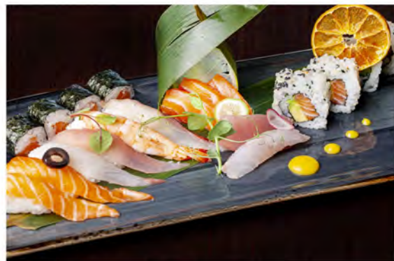
85. Sushi sashimi € 22,00 piatto misto con nigiri 6pz, uramaki 4pz, hosomaki 4pz, sashimi 6pz