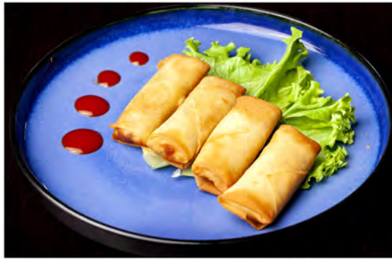
01. involtini primavera € 6,00 involtino con verdure