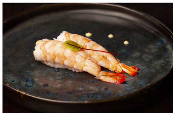
42. Nigiri gambero cotto € 4,50 gambero cotto