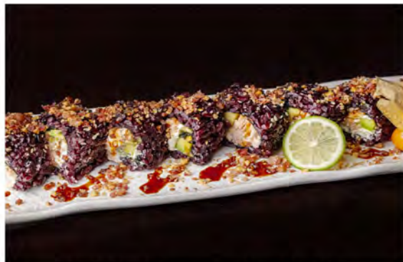
136. Black bacon roll € 11,00 rotolo di riso venere con alga nori interno, farcito con salmone griglia, philadelphia,avocado,guarnito con bacon di arachidi, salsa teriyaki