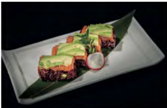
141. Black saudade € 10,50 box di riso venere con sopra spicy salmone avocado e salsa teriyaki