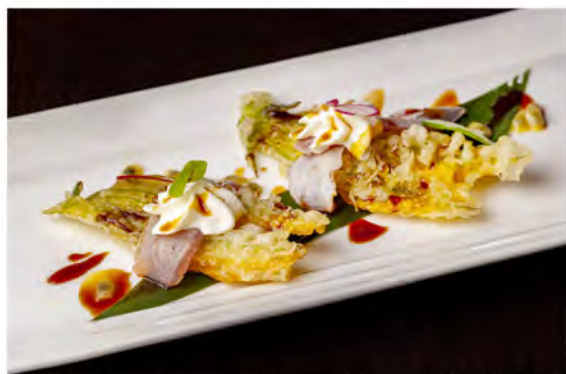
W16. Carpaccio flower tuna € 9,00 tempura di fiori di zucca avvolto con fette di tonno scottato guarnito con salsa teriyaki