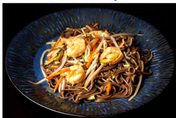
152. Yaki soba € 8,00 spaghetti grano saraceno con gamberi,uova verdure miste di stagione