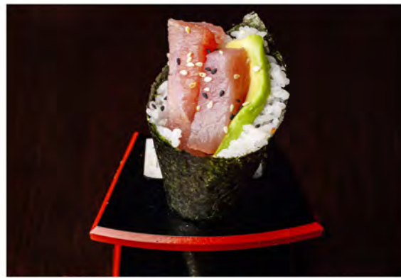
75. Temaki tonno avocado € 6,00 tonno,avocado