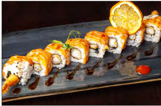
113. Tiger roll € 12,00 gambero fritto, maionese, alga nori, riso e salmone all'esterno salsa teriyaki