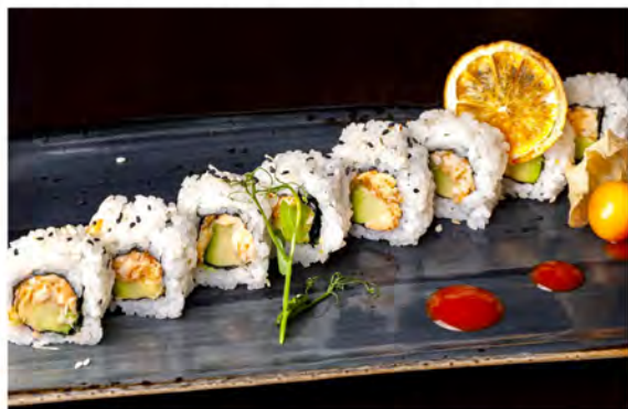
123. Ura cooked ebi € 10,00 rotolo di riso con alga nori interno farcito con pasta di gambero cotto,avocado,maionese,tobiko sesamo