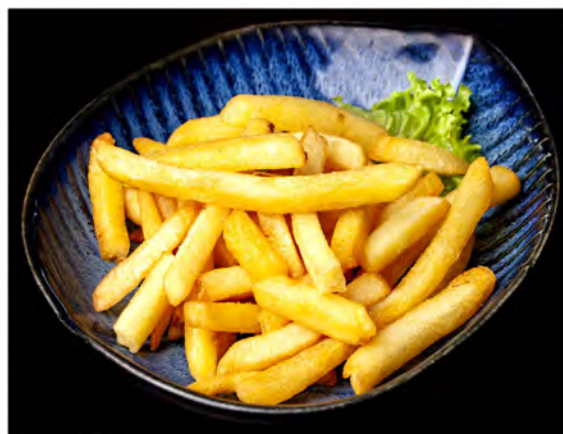
184. Patatine fritte € 4,00 patate fritte tagliate alla julienne