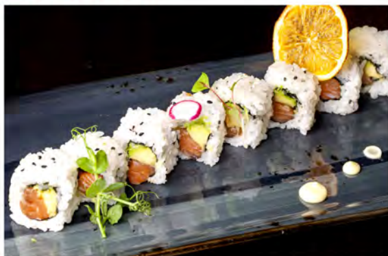
105. Uramaki salmone avocado € 9,00 salmone,avocado,alga nori,sesamo,riso