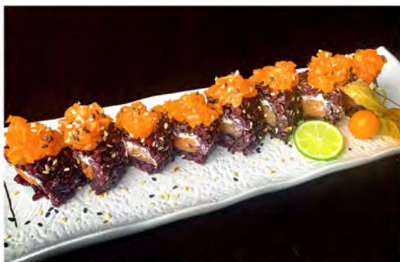
138. Black spicy roll € 10,50 rotolo di riso venere con alga nori interno, farcito con salmone philadelphia guarnito con tartare di salmone piccante,sesamo