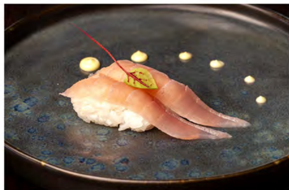
40. Nigiri tonno € 5,00 tonno crudo