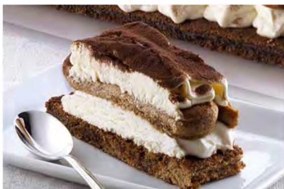
TIRAMISÙ CON SAVOIARDI € 5,00