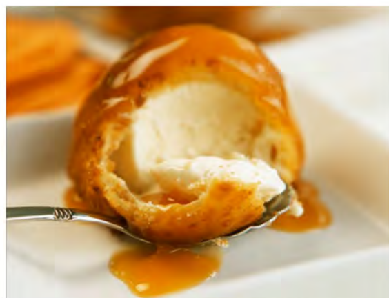
GELATO FRITTO € 5,00