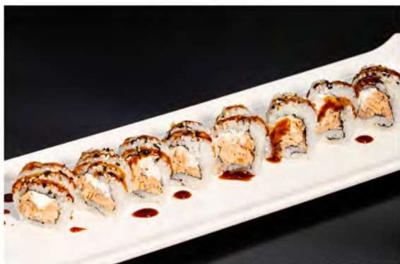
109. Uramaki miura € 9,00 salmone,grigliato,philadelphia alga nori,sesamo,riso e salsa teriyaki