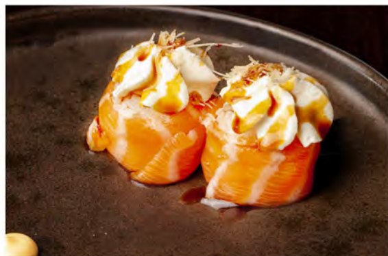
56. Gunkan taste € 7,50 bocconcini di riso avvolto da salmone con philadelphia pasta kataifi in salsa teriyaki