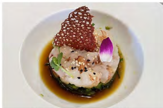
W6. Tartare Amaebi € 11,00 tartare di gambero dolce, sotto con goma wakame, guarnito con salsa ponzu