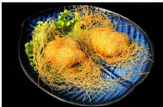
W20. Capesante kataifi € 10,00 fette di capesante avvolto con kataifi fritto