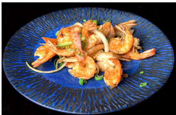
166. Gamberi sale e pepe € 9,00 gambero saltato in sale e pepe con cipolla e peperoni