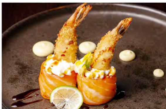
57. Gunkan ebiten € 8,00 bocconcini di riso avvolto da salmone con philadelphia, gambero fritto in salsa teriyaki