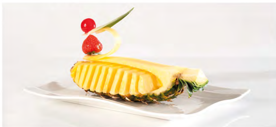
ANANAS FRESCO € 5,00