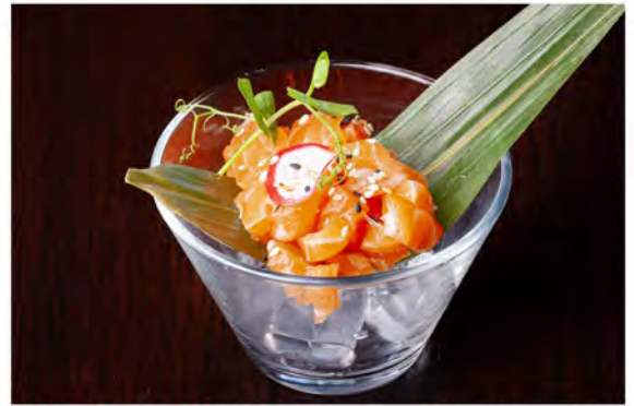
● 26. Tartare salmone € 9,00 salmone tagliato a mano con salsa ponzu e sesamo