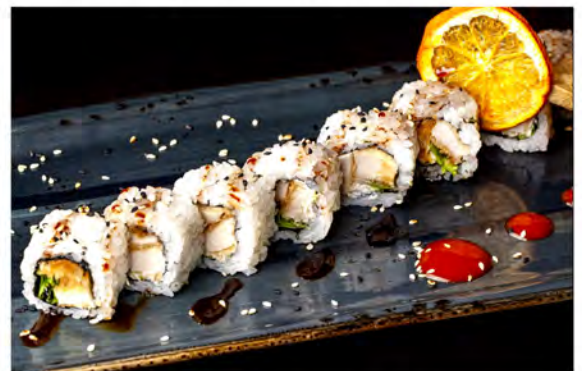
120. Chicken roll € 9,00 rotolo di riso con alga nori interno con pollo fritto, philadelphia insalata, sesamo in salsa teriyaki