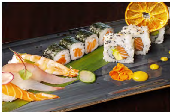
84. Sushi misto € 13,00 piatto misto con nigiri 4pz, uramaki 4pz, hosomaki 4pz