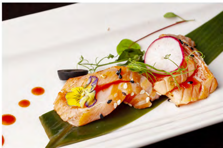
83. Sashimi flambe € 12,00 salmone scottato con sesamo