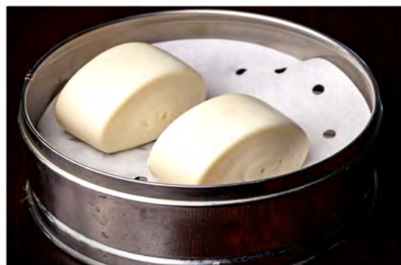
12. Pane orientale € 4,00 pane di latte al vapore con salsa latte condensato