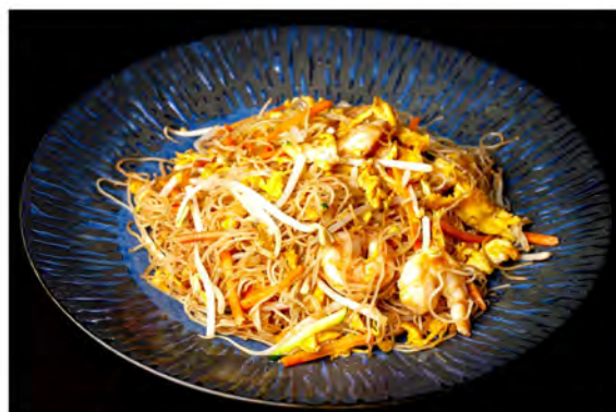
148. Spaghetti di riso € 7,00 spaghetti di riso con gamberi, verdure miste di stagione,uova