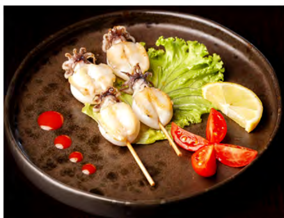
159. Spiedini di seppie € 8,00 seppie con salsa teriyaki e sesamo