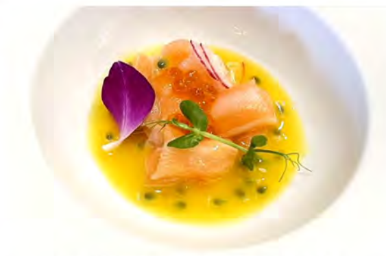
W8. Carpaccio passion € 10,00 fette di salmone guarnito con passion fruit