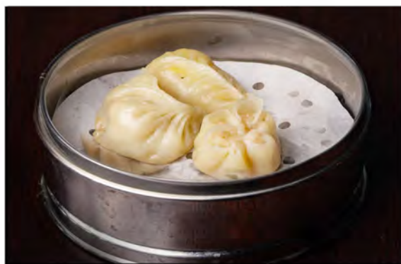
11. Ravioli misti € 6,50 carne di maiale,verdure,gamberi in salsa di soia