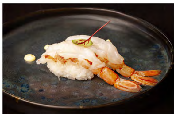
44. Nigiri amaebi € 5,00 gambero crudo