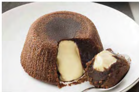
SOUFFLÉ BLACK & WHITE € 5,00