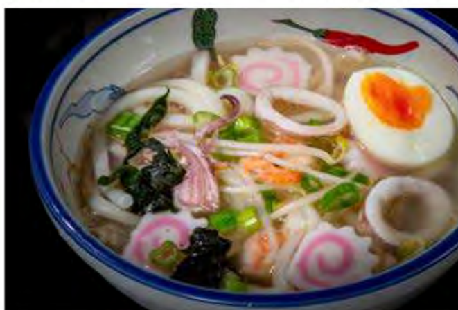
156. Ramen con frutti di mare € 7,00 verdure di stagioni e frutti di mare,uova