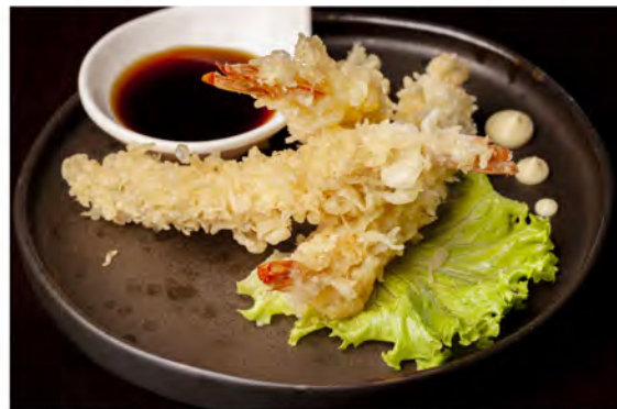
189. Tempura gamberoni € 11,00 gamberoni fritti in tempura