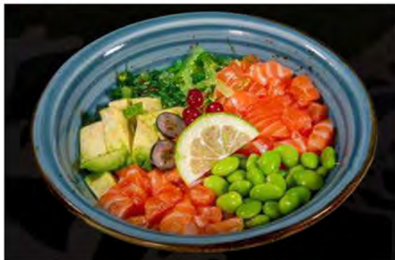
90. Poke watami € 13,00 base di riso con avocado, edamame, salmone e goma wakame