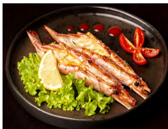
162. Gamberoni alla piastra € 10,00 gamberoni con salsa teriyaki e sesamo