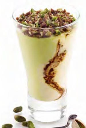
CREMA E PISTACCHIO € 5,50