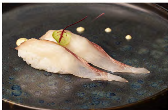
45. Nigiri ricciola € 5,00 ricciola crudo