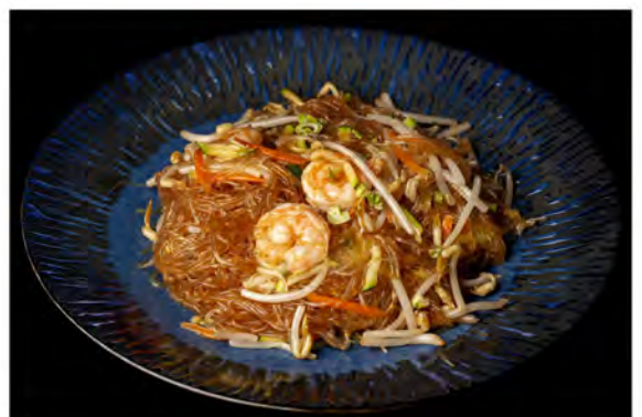
149. Spaghetti di soia € 7,00 spaghetti di soia con gamberi, verdure miste di stagione