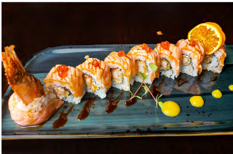
W26. Gamberoni roll