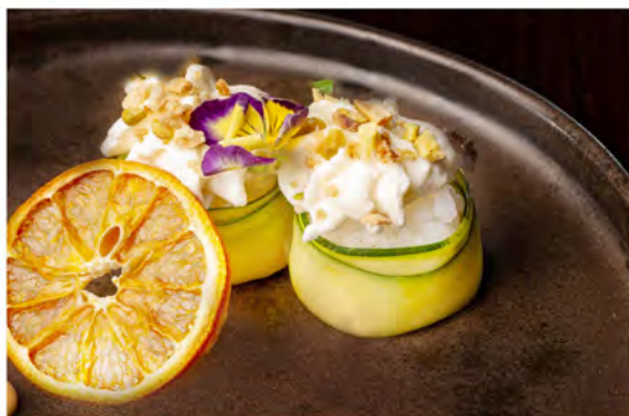
59. Gunkan zucchini soft € 7,50 bocconcini di riso avvolti con zucchine farcite con philadelphia, granelle di pistacchio misto