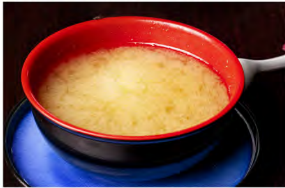
17. Misoshiru € 4,50 zuppa di soia con tofu, alghie giapponese e erba di cipollina