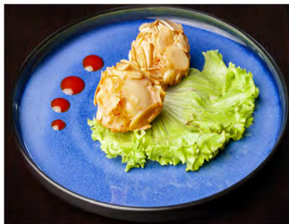
186. Polpette di gamberi € 7,00 gamberi, surimi e mandorle