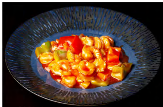
167. Gamberi piccante € 9,00 gamberi saltati con peperoni, bambu cipolle in salsa piccante