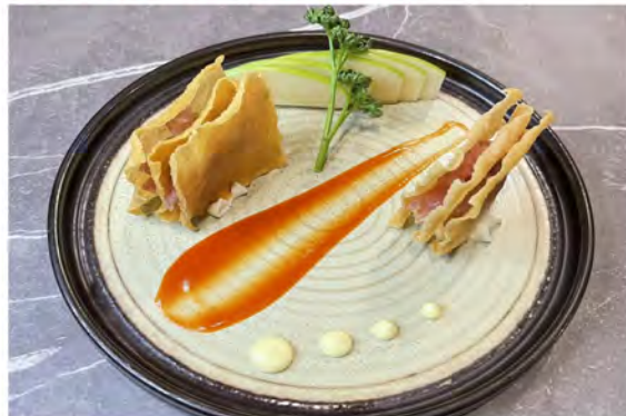
W2. Millefoglie tonno € 10,00 sfoglietta croccante con tonno piccante maionese tobiko e philadelphia