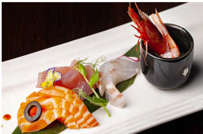
82. Sashimi mix € 14,00 salmone, tonno, branzino, gambero rosso