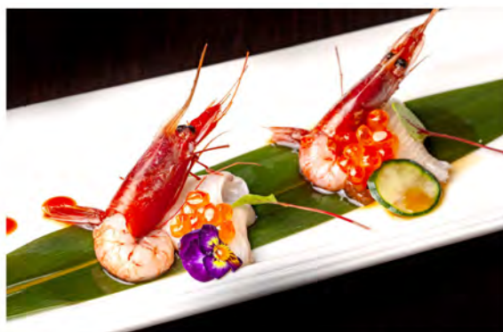
W24. Ricciola gambero rosso € 12,00 gambero rosso avvolto con carpaccio ricciola guarnito con ikura in salsa ponzu