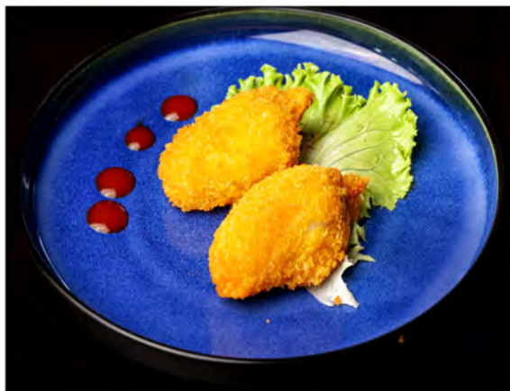
181. Chele di granchio € 6,00 polpa di granchio impanati e fritti