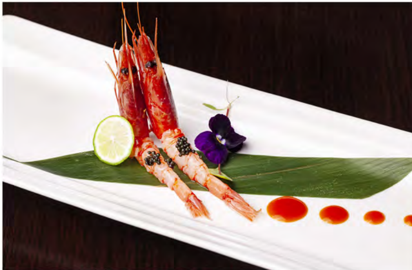
W22. Gambero rosso € 9,00 gambero rosso, guarnito con uova di lompo