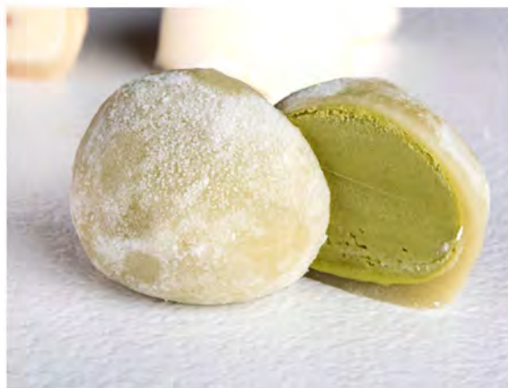
MOCHI (2 PEZZI) gusti: Cioccolato, Fruit passion, Mango, Cocco, The verde € 5,00