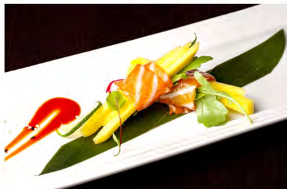
W21. Involtni salmone € 8,00 rucola, mango, avvolto con salmone in salsa ponzu