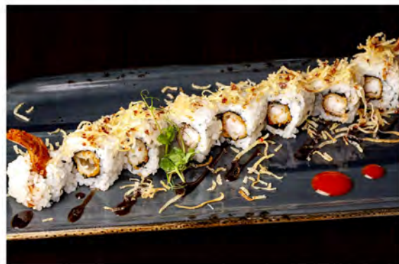
112. Uramaki ebiten € 10,00 gamberi fritto,maionese, croccante di patate in salsa teriyaki