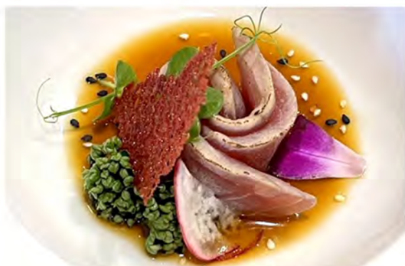
⑤ 37. Carpaccio tuna € 11,00 tonno scottato con salsa ponzu e sesamo