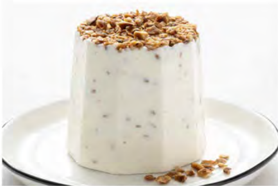
SEMIFREDDO AL TORRONCINO € 6,00