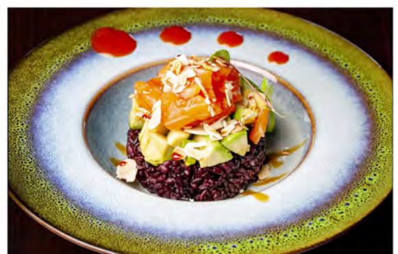
● 32. Tartare venus € 11,00 tartare di salmone con base di riso venere coperto da avocado, mandorle in salsa teriyaki