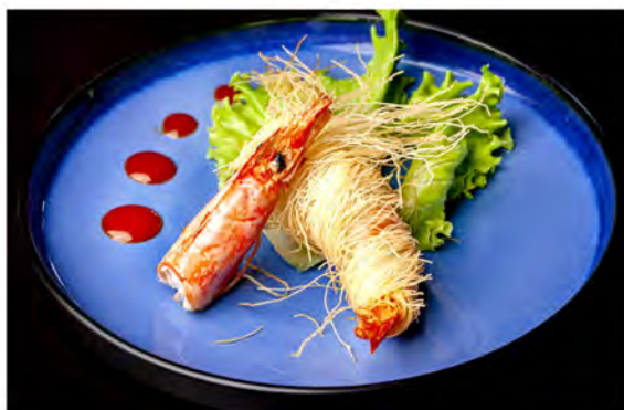
W18. Gamberoni kataifi € 10,00 gamberoni, avvolto in pasta kataifi fritto e miele