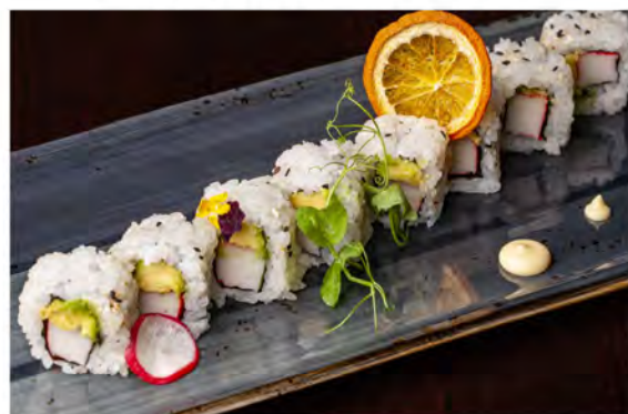
108. Uramaki california € 9,00 surimi,avocado,maionese, alga nori,sesamo,riso