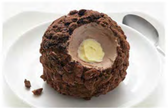
TARTUFO CLASSICO € 5,20