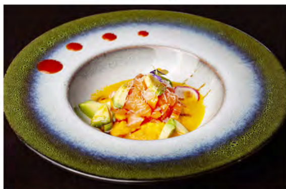
W3. Tartare sake € 10,00 tartare di salmone con avocado, salsa carote, guarnito con kataifi in salsa teriyaki