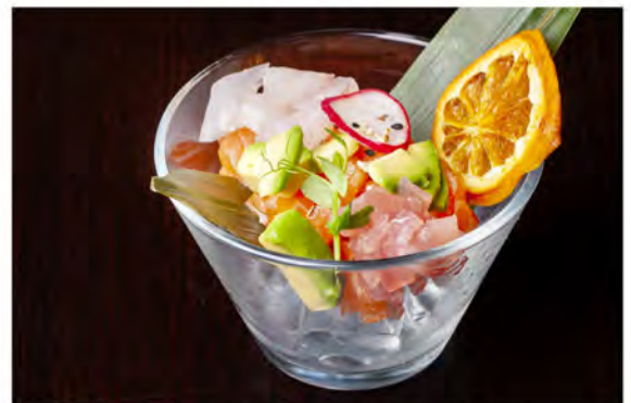
● 30. Tartare watami € 11,00 tartare mista con avocado, in salsa ponzu con sesamo