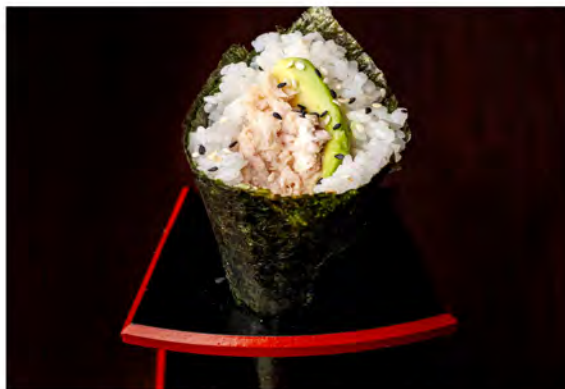
78. Temaki miura avocado € 5,50 salmone grigliato,philadelphia, avocado,salsa teriyaki