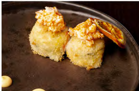
65. Gunkan fry ebi € 8,00 bocconcini di riso fritto avvolto da zucchine, guarniti con tartare gambero