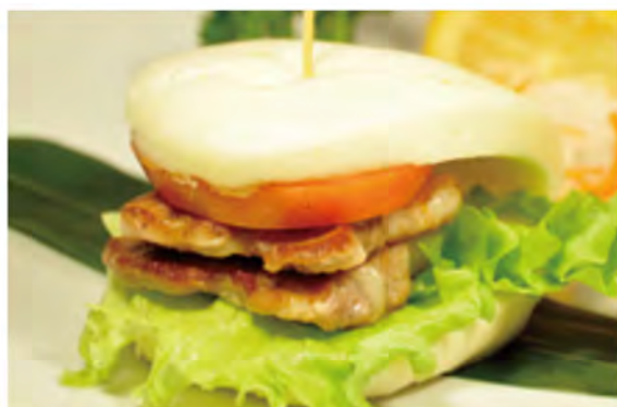
15. Bao maiale € 5,00 pancetta grigliato, insalata, pomodoro in salsa teriyaki