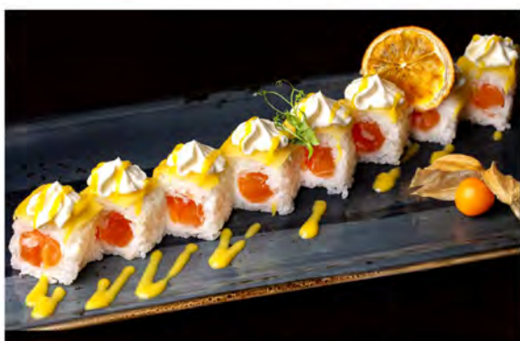
127. Mango fresh € 11,00 rotolo di riso farcito con salmone,philadelphia esterno con fette di mango e salsa mango