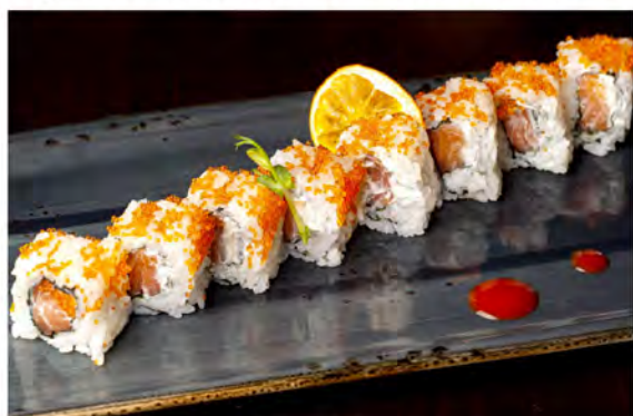
125. Tobiko roll € 11,00 rotolo di riso con alga nori interno farcito con salmone,philadelphia,esterno tobiko