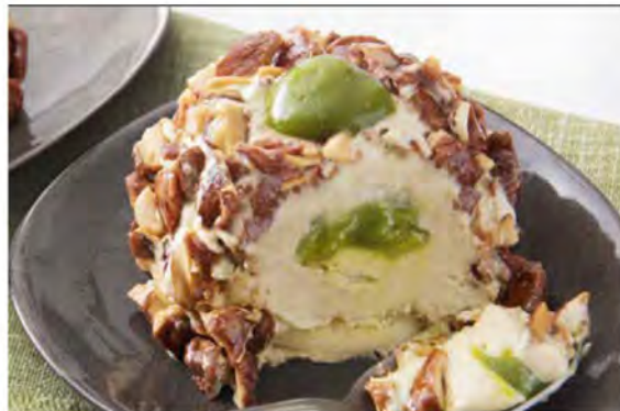
CROCCANTE AL PISTACCHIO € 5,50