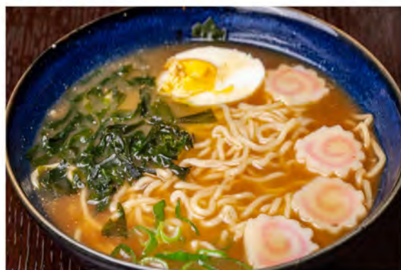
154. Ramen con verdure € 6,00 verdure di stagioni e uova