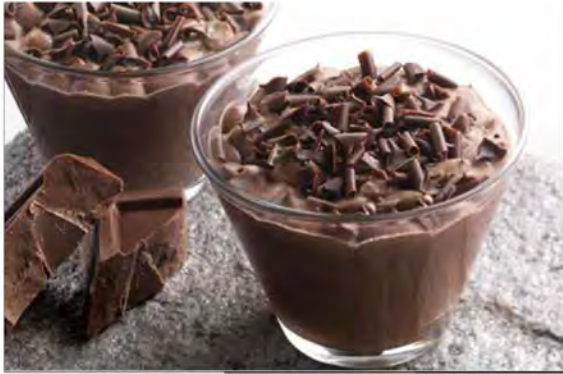
COPPA MOUSSE CIOCCOLATO € 6,00