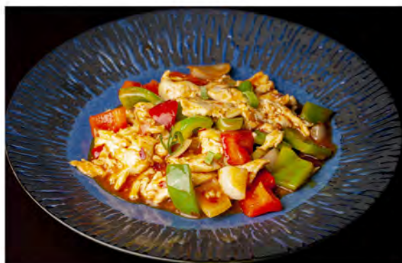
172. Pollo piccante € 8,00 pollo saltato con peperoni, cipolle in salsa piccante