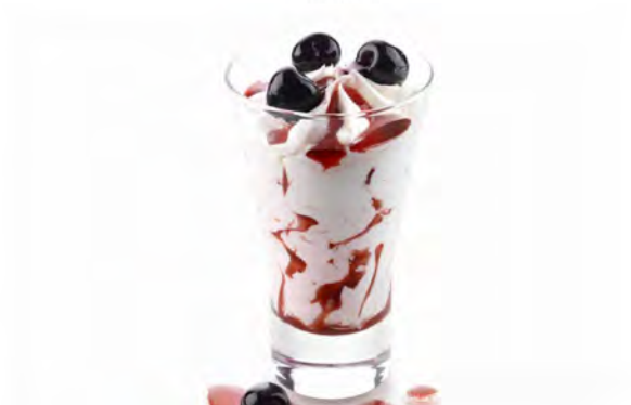
SPAGNOLA € 5,50