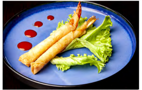
02. involtini di gamberi € 6,00 involtino di gamberi