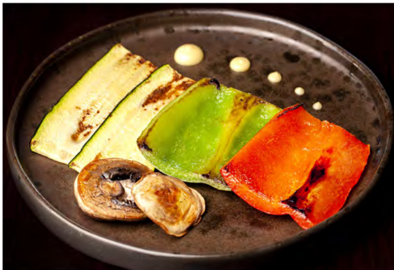
163. Verdure miste alla piastra € 6,50 zucchine, melanzane, peperoni, funghi