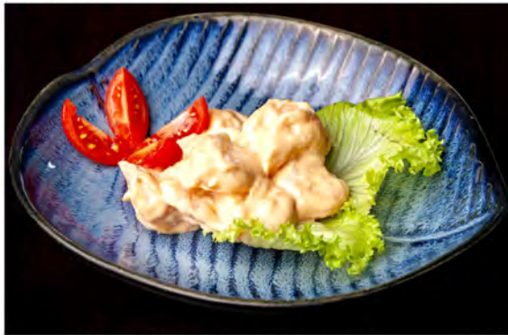
● 25. Gamberi cocktail € 9,00 gamberi in salsa cocktail