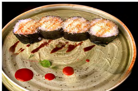
94. Futomaki ebiten € 11,00 rotolo di riso con alga nori esterno con gambero fritto, philadelphia, tobiko, kataifi in salsa teriyaki