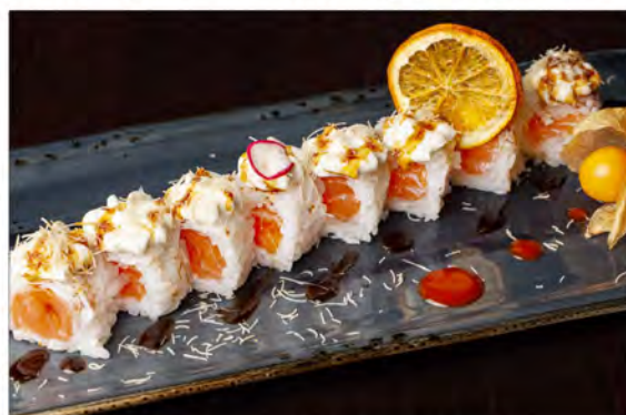
126. Salmon fresh € 10,00 salmone e riso con all'esterno philadelphia pasta croccante,salsa teriyaki