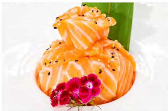
88. Sake don € 10,00 ciotola di riso con sashimi di salmone e sesamo