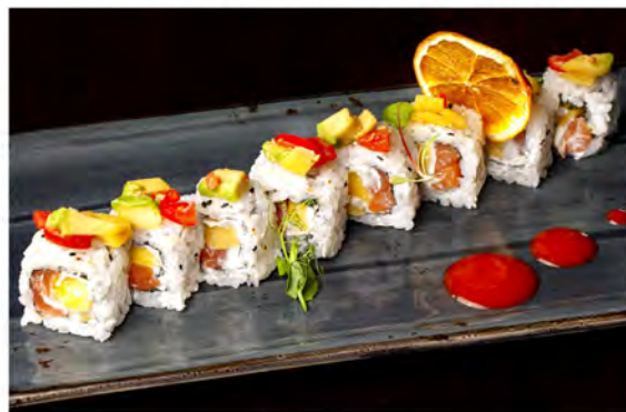
124. Mango plus € 11,00 rotolo di riso con alga nori interno con salmone,mango, philadelphia guarnito con avocado mango,pomodori,salsa mango