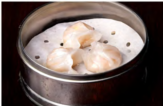
09. Ravioli di cristallo € 7,50 gamberi in salsa di soia