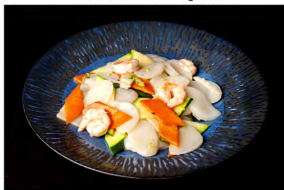
153. Gnocchi di riso € 7,50 gnocchi saltato con gamberi verdure miste di stagione