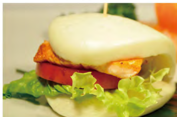
16. Bao salmone € 6,00 salmone alla piastra,insalata, pomodoro in salsa teriyaki