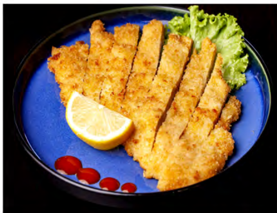
185. Cotoletta di pollo € 7,00 petto di pollo impanato e fritto