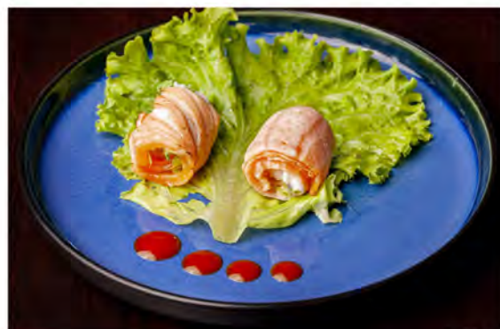
W19. Salmone watami € 9,00 tempura di gambero, philadelphia, lattuga, avvolto da salmone scottato, salsa rosa