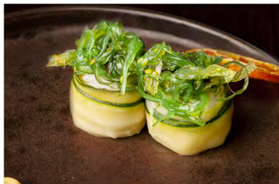
60. Gunkan goma wakame € 7,00 bocconcini di riso avvolti da zucchine con alghe piccanti