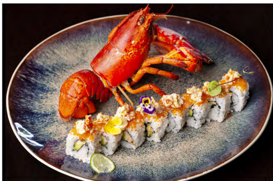
W28. Astice roll 4pz € 17,00

rotolo di riso con alga nori interno, farcito con astice cotto tagliato e mescolato con maionese, avocado, guarnito con tobiko all'esterno