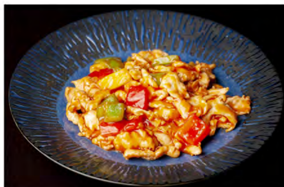
173. Pollo agrodolce € 8,00 pollo saltato con peperoni, ananas in agrodolce