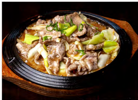
179. Manzo alla piastra piccante € 9,00 manzo con cipollotti piccanti