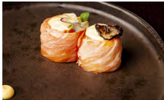
● 67. Gunkan tartufi € 10,50 bocconcini di riso avvolto con salmone scottato guarniti con maionese, zafferano, tartufo