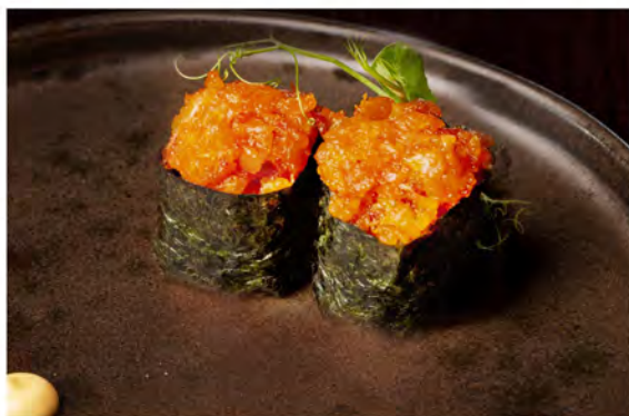
51. Gunkan salmon € 7,00 bocconcini di riso avvolto con alga di nori coperto da tartare di salmone piccante