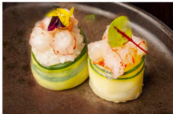
62. Gunkan hanabi € 10,50 bocconcini di riso avvolti da zucchine farcite con tartare di gambero rosso