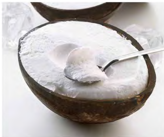
COCCO RIPIENO € 6,50