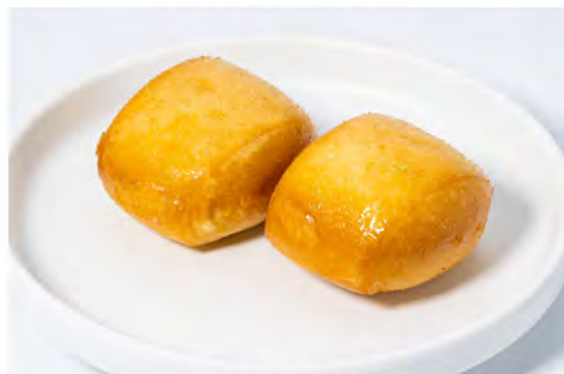
14. Pane fritto € 4,50 pane di latte al vapore fritto con salsa latte condensato