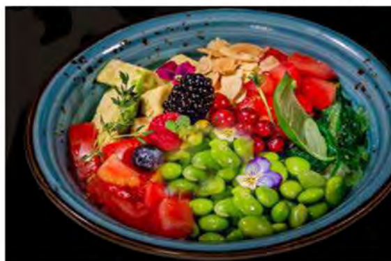
92. Poke vegan € 12,00 base di riso con avocado, edamame goma wakame, pomodoro e mandorle