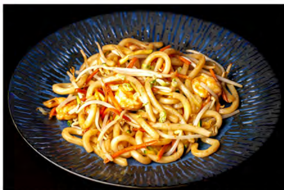
150. Udon gamberi € 8,00 spaghetti di udon con gamberi,uova verdure miste di stagione