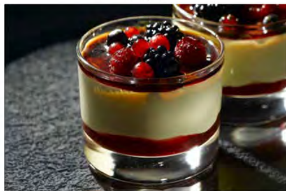
COPPA CREME BRULEE E FRUTTI DI BOSCO € 5,80