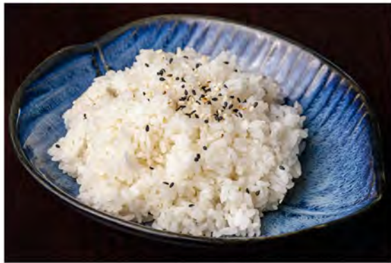
142. Gohan € 3,50 riso bianco con sesamo