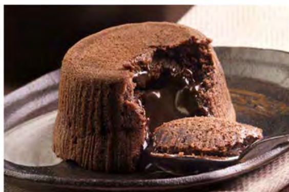
SOUFFLÉ AL CIOCCOLATO € 5,00