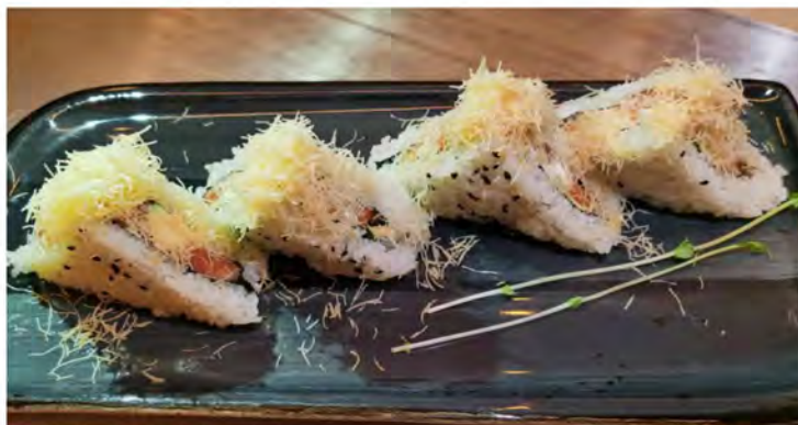
133. Sandwich € 9,50 tramezzini salmone, avocado, philadelphia, kataifi e salsa teriyaki