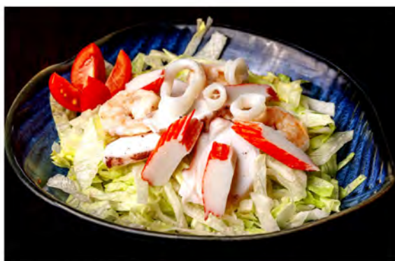
23. Insalata di mare € 7,00 insalata con calamari,polipo,gamberetti in salsa ponzu e olio d'oliva