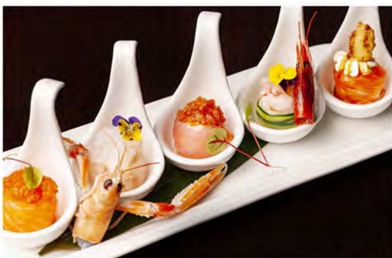
W13. Bigne festival € 13,00 bocconcini di riso avvolto con salmone, sopra salmone piccante, tonno piccante, ricciola con sopra scampi, guarnito con uova di lompo, salmone con sopra philadelphia, gambero di tempura, salsa teriyaki, zucchini con sopra amaebi