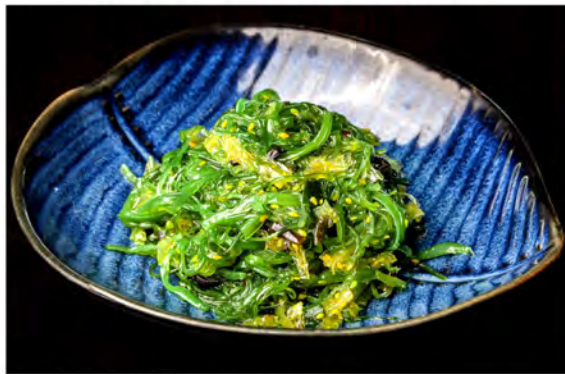
19. Goma wakame € 6,00 alghie piccanti in salsa dolce piccante