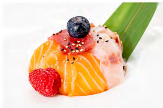
89. Chirashi don € 11,00 ciotola di riso con sashimi di salmone, tonno, branzino e sesamo