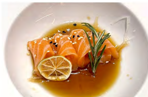
⑤ 33. Carpaccio salmone € 9,00 salmone tagliato a fette sottili con salsa ponzu e sesamo