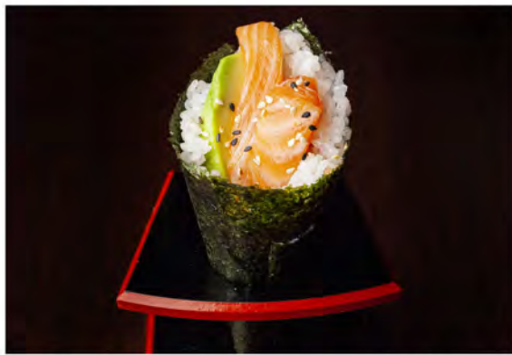
74. Temaki salmone avocado € 5,00 salmone,avocado