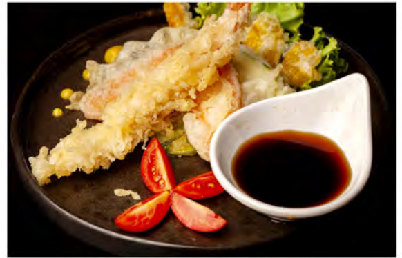
188. Tempura mix € 10,00 fiori di zucca, verdure miste e gamberoni fritti in tempura