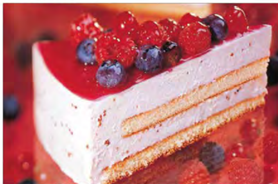
MOUSSE YOGURT E FRUTTI DI BOSCO € 5,00