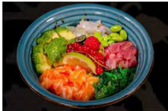
91. Poke fish € 15,00 base di riso con salmone, tonno, branzino, edamame, goma wakame e avocado