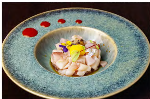
W5. Tartare ricciola € 11,00 tartare di ricciola con sopra uova di quaglia, guarnito con salsa ponzu, salsa tartufo nero