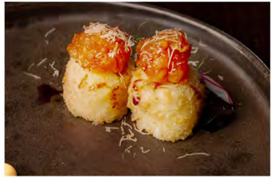
64. Gunkan fry salmon € 8,50 bocconcini di riso fritti avvolto con salmone, guarniti con tartare di salmone piccante, salsa teriyaki, kataifi