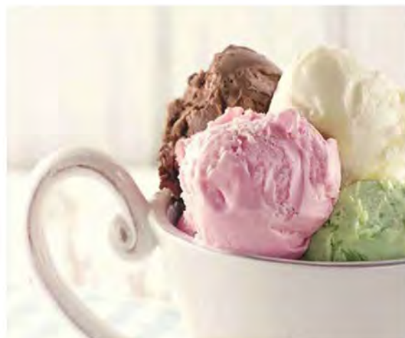
COPPA GELATO MISTA € 4,50