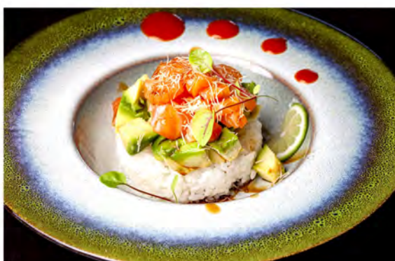
● 31. Tartare yukimai € 10,00 tartare di salmone con base di riso bianco, coperto da avocado, kataifi in salsa teriyaki