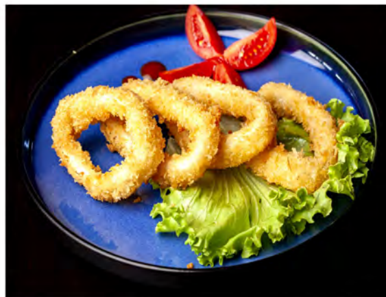
182. Calamari fritti € 9,00 anelli di calamari impanati