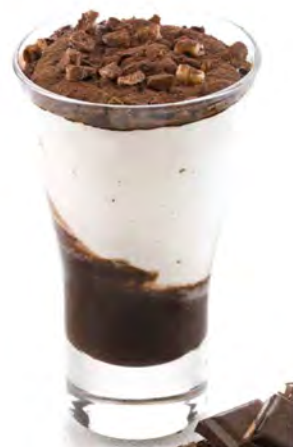
STRACCIATELLA € 5,50