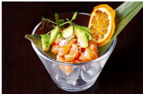
● 27. Tartare salmone avocado € 10,00 salmone con avocado tagliato a mano con salsa ponzu e sesamo