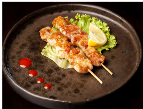
158. Spiedini di pollo € 8,00 pollo con salsa teriyaki e sesamo