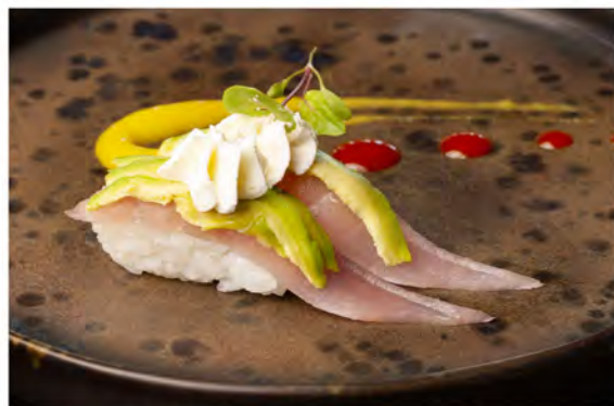
48. Nigiri soft tuna € 6,50 tonno,avocado,philadelphia