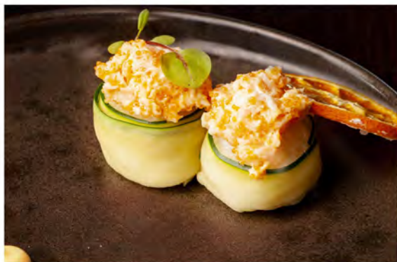
61. Gunkan ebi € 7,50 bocconcini di riso, avvolti da zucchine con tartare di gambero cotto e maionese