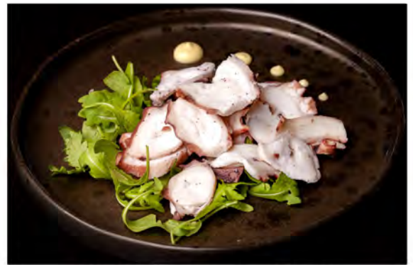
20. Polipo e rucola € 9,00 insalata di polipo e rucola in salsa ponzu e olio d'oliva