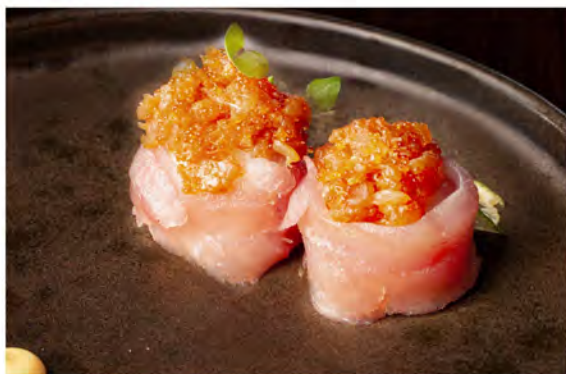
55. Gunkan spicy tuna € 8,00 bocconcini di riso avvolti da tonno con tartare di tonno maionese, tobiko, salsa piccante