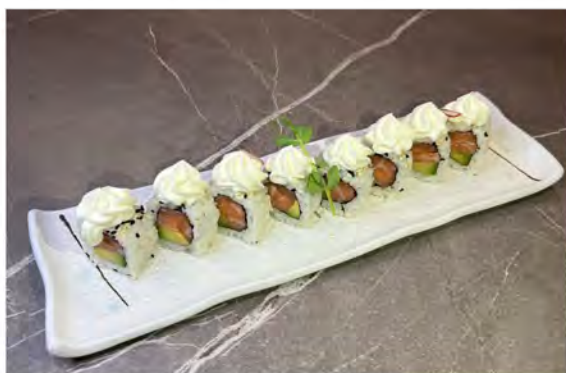
107. Uramaki philadelphia € 10,00 salmone,philadelphia,alga nori,sesamo, riso,avocado