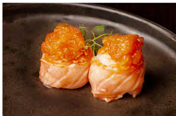
58. Gunkan flambe € 8,00 bocconcini di riso avvolti da salmone scottato con sopra salmone piccante