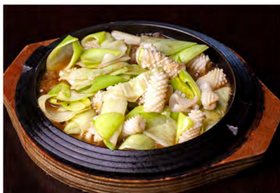
180. Seppia alla piastra piccante € 9,00 seppia alla piastra piccante