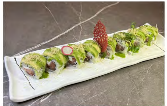
116. Rucola roll € 8,50 salmone e philadelphia con sopra avocado, kataifi e crema di rucola