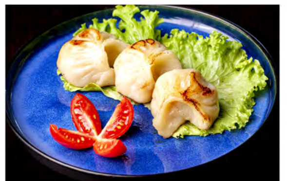
08. Ravioli alla piastra € 6,50 carne di maiale in salsa soia