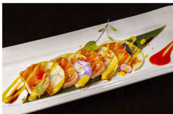
W12. Sashimi ao smith € 11,00 sashimi di salmone scottato con mela verde granny smith guarnito con tobiko, salsa mango, salsa teriyaki