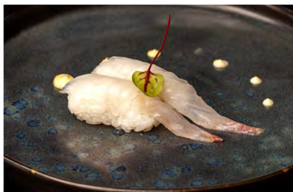
41. Nigiri branzino € 4,50 branzino crudo