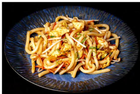
151. Udon pollo € 8,00 spaghetti di udon con pollo,uova verdure miste di stagione