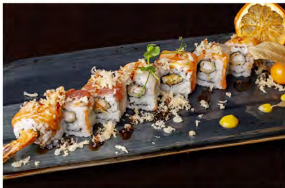
129. Monte mix roll € 13,00 rotolo di riso con alga nori interno farcito con gambero fritto, maionese, guarnito con pesce misto, croccante di tempura in salsa teriyaki