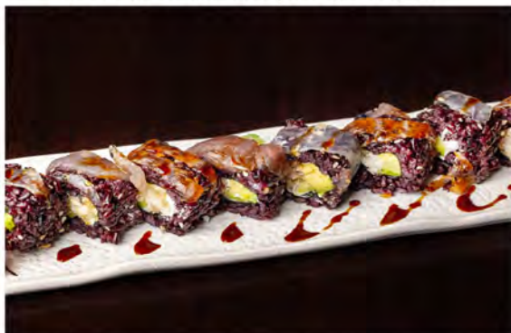
140. Black mix roll € 13,50 rotolo di riso venere con alga nori interno, farcito con gambero fritto,avocado,philadelphia, guarnito con pesce misto sesamo in salsa teriyaki