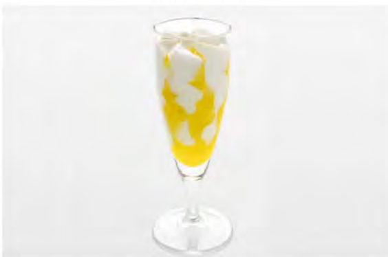
FLUTE LIMONCELLO € 6,00